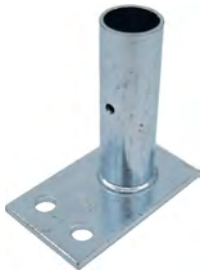
↑ IV-kuilukannakkeen jalka