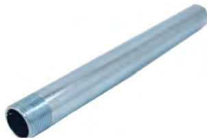
↑ IV-kuilukannakkeen putki

Pinta: SÄHKÖSINK. 5-9 μ Korroosioluokka: C1