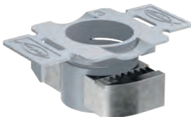
↑ FCN Clix P

Pinta: KUUMASINKITTY MIN. 40 μ Korroosioluokka: C3 Plastskive: 30 x 50 mm