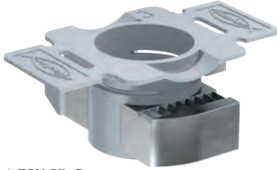
↑ FCN Clix P

Pinta: SÄHKÖSINK. Korroosioluokka: C1 Plastskive: 30 x 50 mm