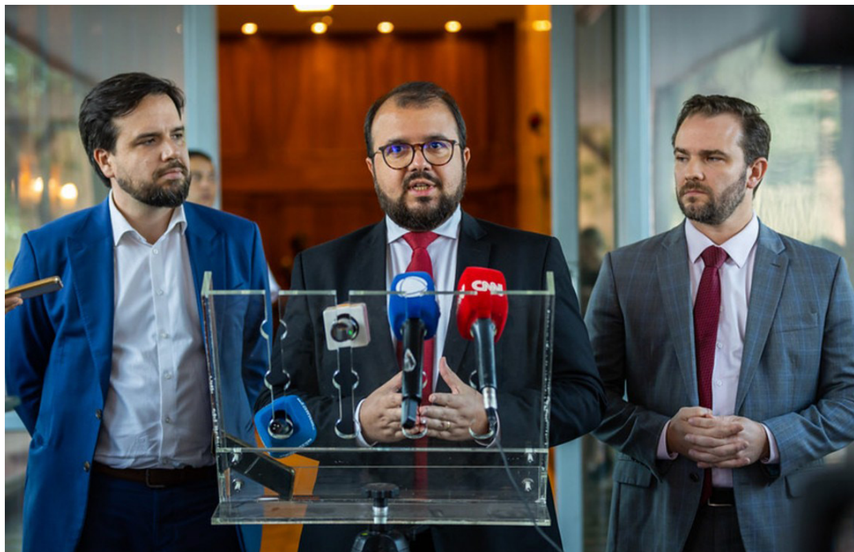
Diogo Zacarias/Ministério da Fazenda

c) contra as fraudes combinadas entre apostadores e jogadores ou clubes profissionais de futebol, todas as empresas de bets precisam se associar a mecanismos nacionais ou internacionais de monitoramento da integridade esportiva. Cabe ainda sublinhar que 12% do valor arrecadado pelas empresas vai para o Governo Federal sob a forma de impostos. Desse montante, parte é direcionada ao Ministério de Saúde, que é a maior instituição responsável, segundo a nova legislação, para “prevenção, controle e mitigação de danos sociais” decorrentes desse fenômeno.