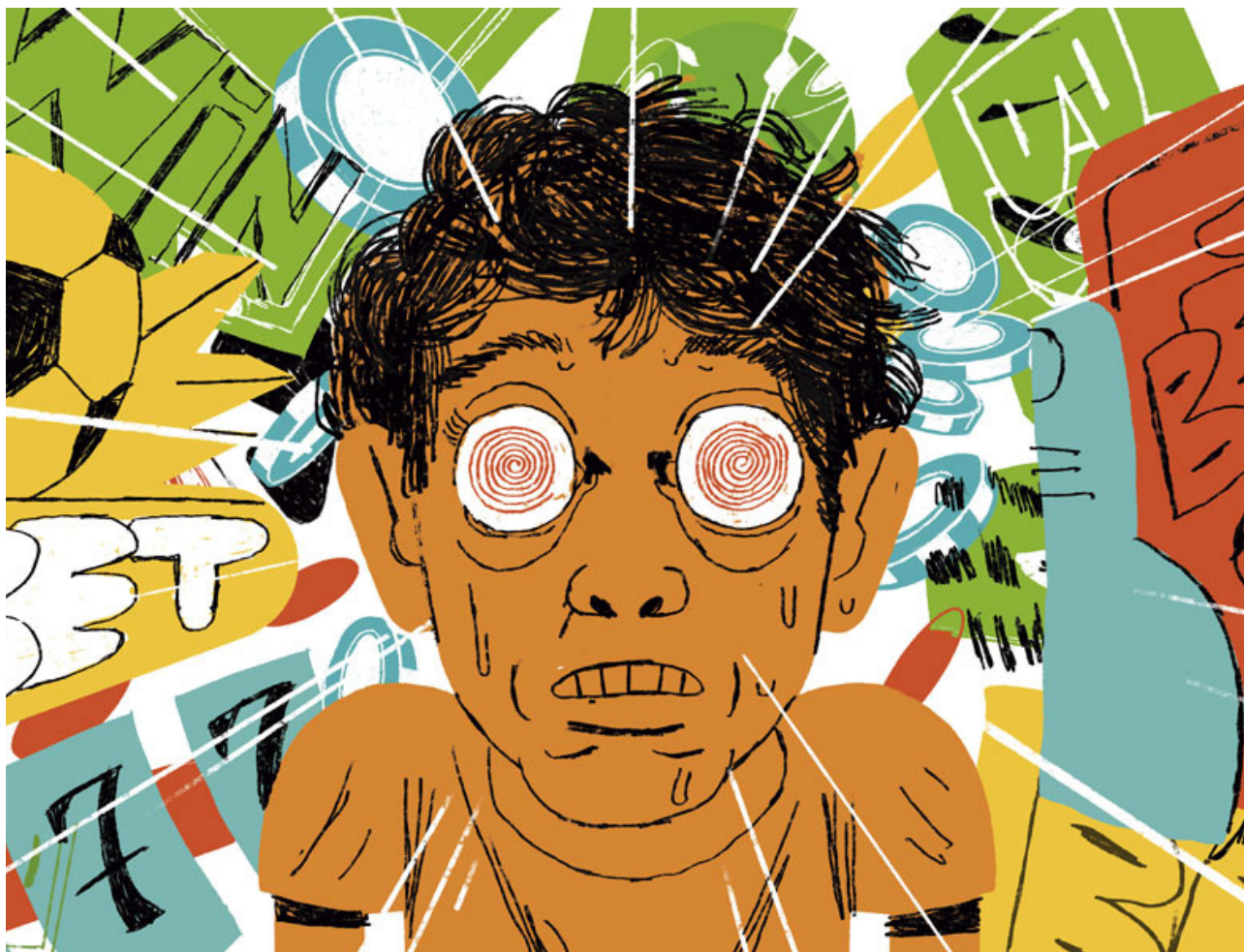
João Montanaro/Revista FAPESP

A Lei 14.790/2023 criou regras mais rígidas para a permissão de empresas de bets no Brasil, estrangeiras ou nacionais. Entre essas regras, estão a exigência de uma quantidade razoável de recursos financeiros disponíveis, maior segurança cibernética em suas plataformas digitais e um plano de continuidade de negócios, pois muitas empresas sequer tinham lastro para os prêmios anunciados e eram comuns os calotes nos apostadores, tipificando o crime de estelionato.