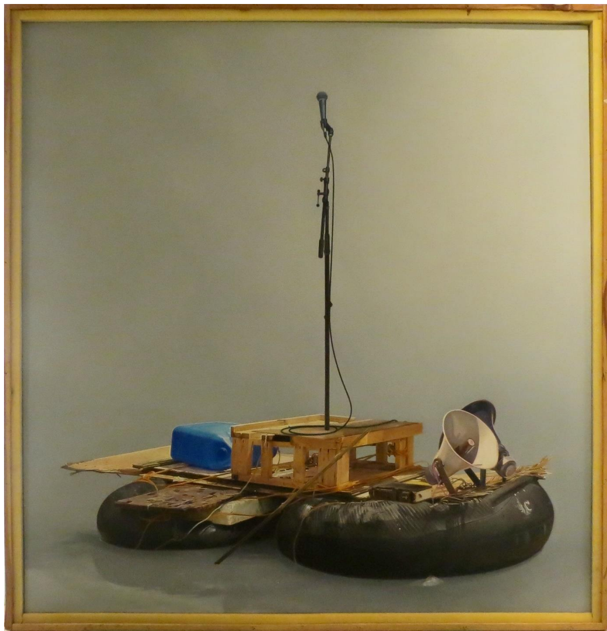
Teología de la prosperidad , 2014