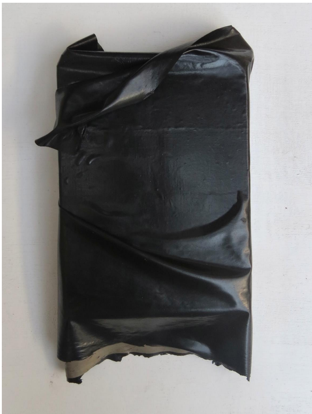
Doble fondo 2, 2023 Óleo sobre tabla 20 x 15 x 2 cm / 7.8 x 5.9 x 0.7 in