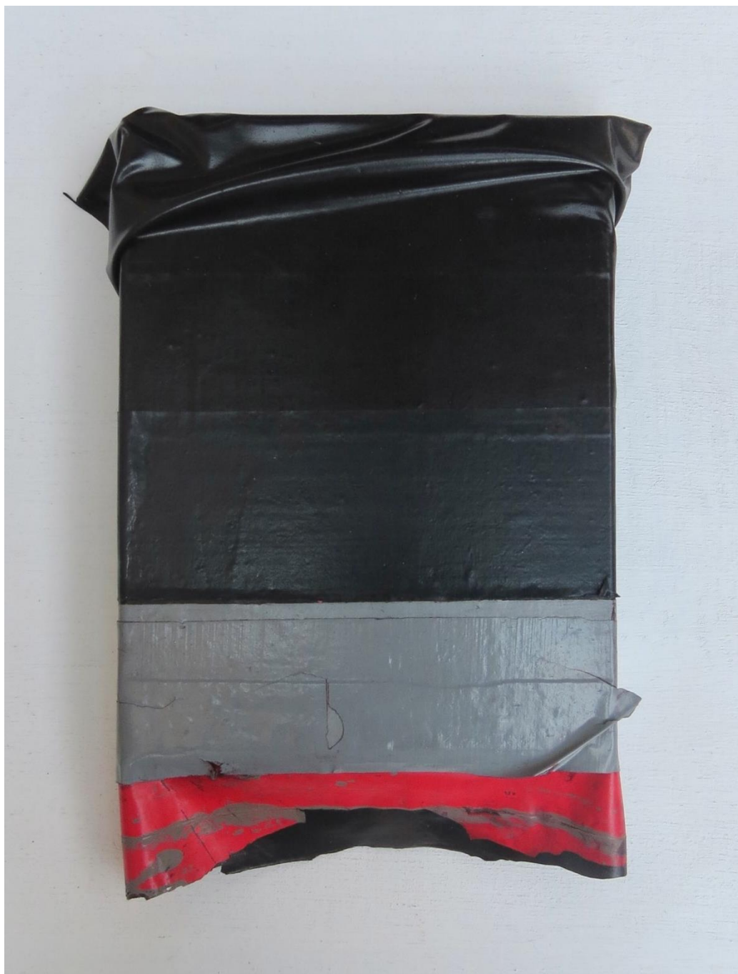
Doble fondo 5, 2023 Óleo sobre tabla 20 x 15 x 2 cm / 7.8 x 5.9 x 0.7 in