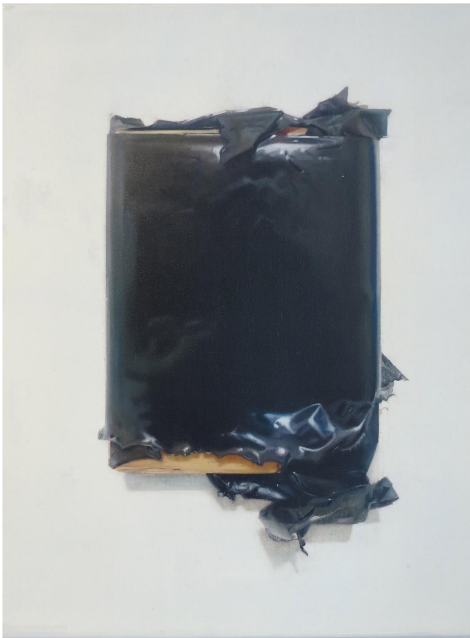
Doble fondo , 2022 Óleo sobre loneta 62 x 48 cm