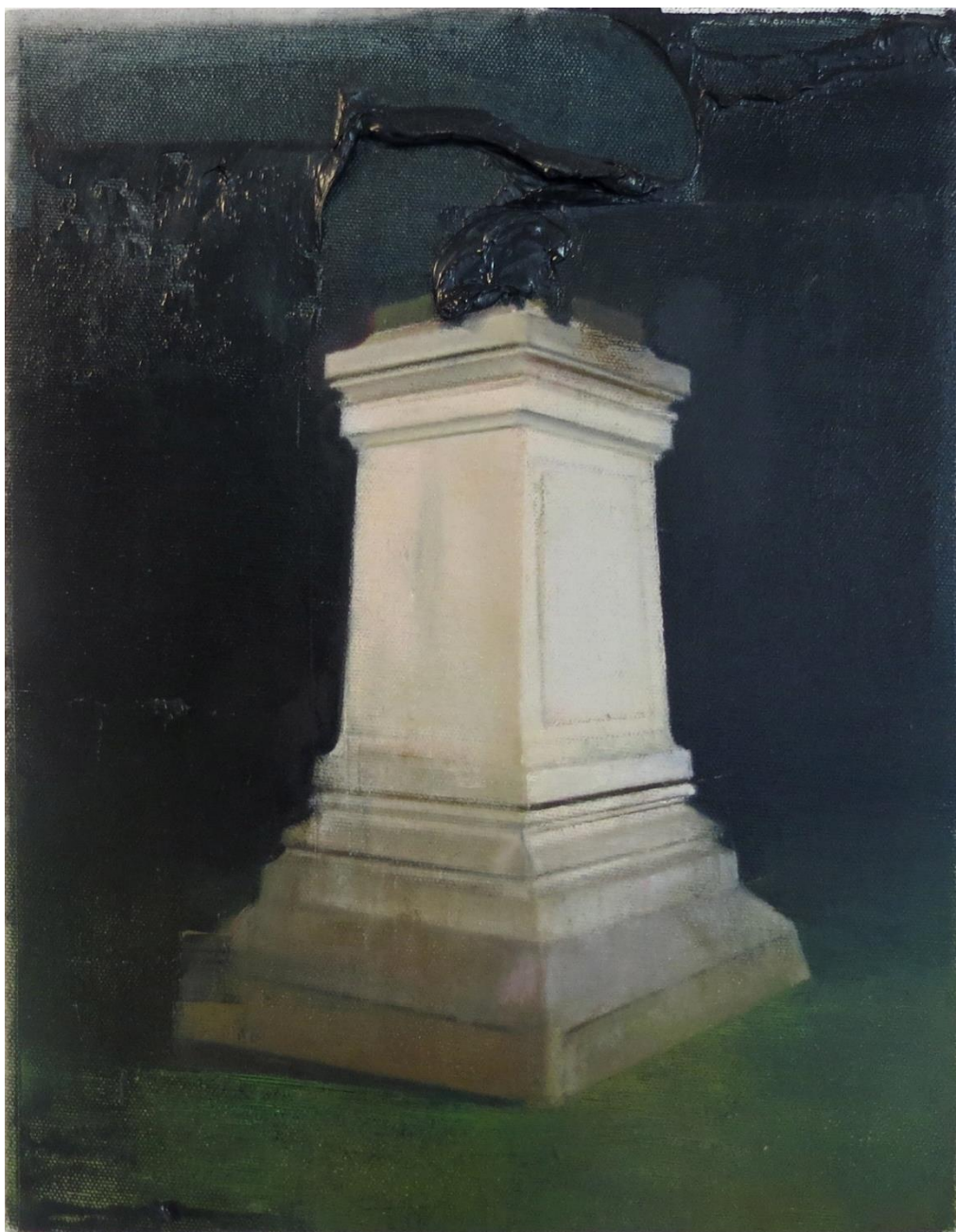
Negro de humo , 2023 Óleo sobre tela 25 x 33 cm/ 9.8 x 13