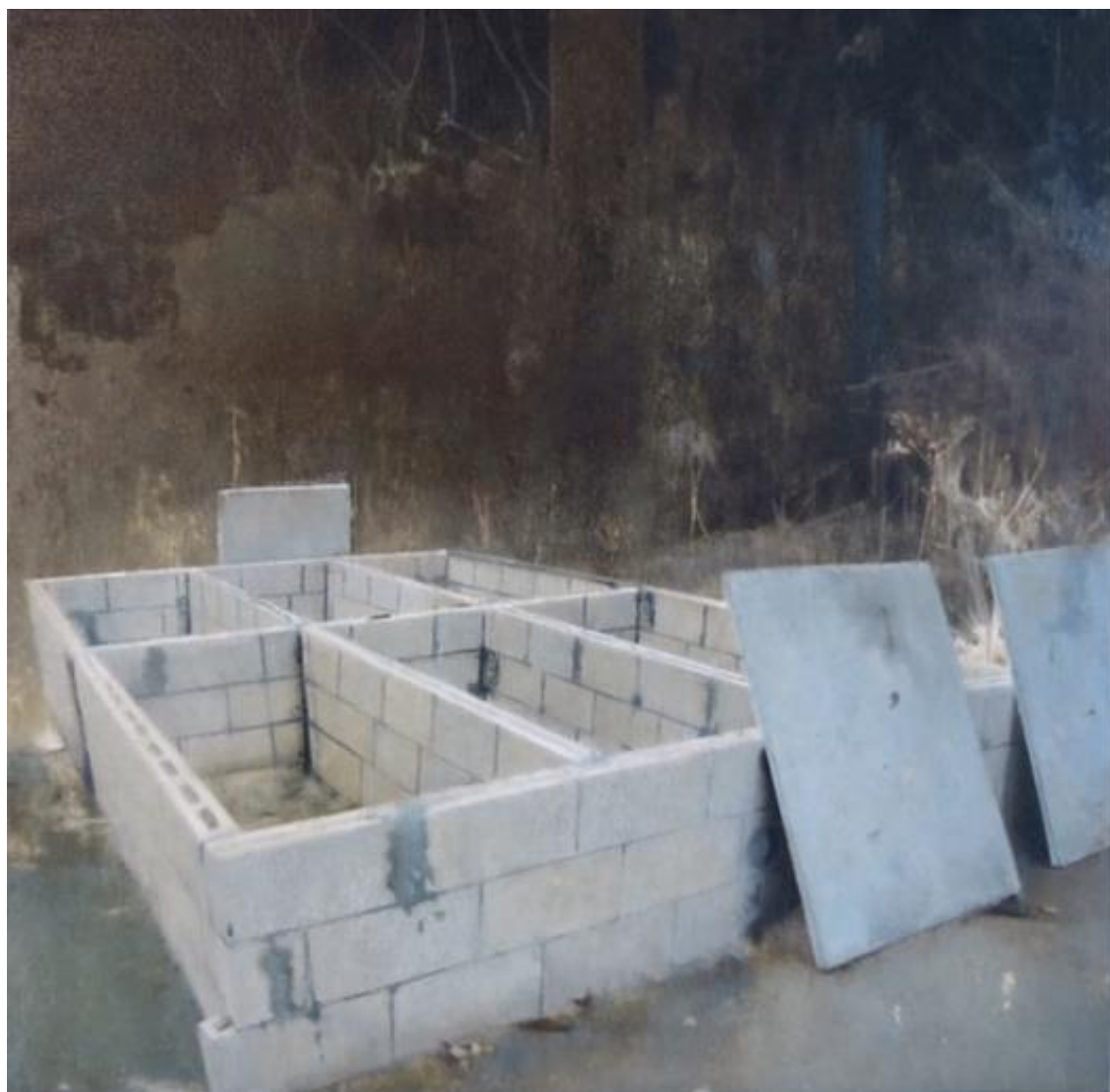
Lugar de tránsito , 2019-2021 Óleo sobre loneta de algodón 59.5 x 60 cm/23.4 x 23.6 in