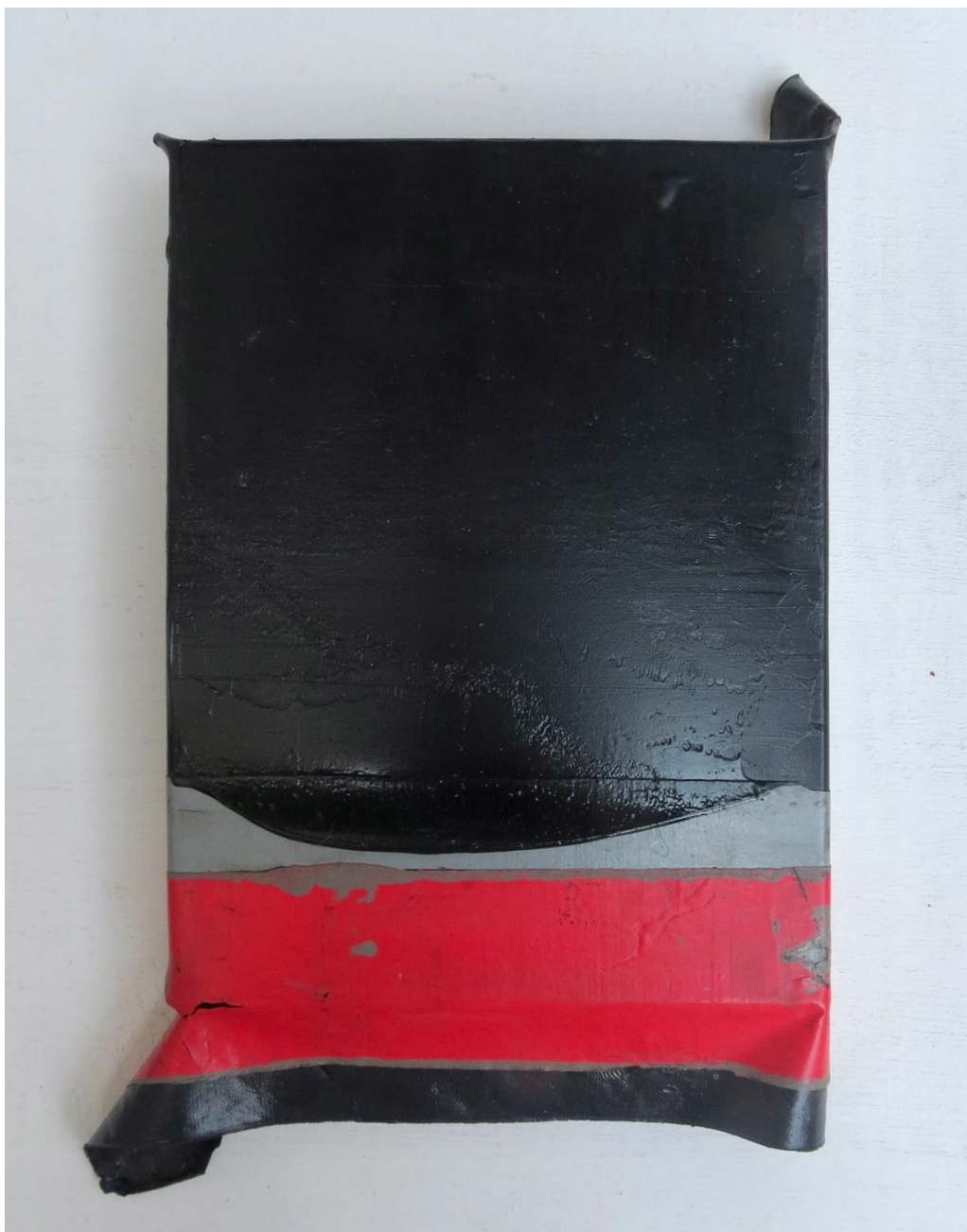
Doble fondo 1 , 2023 Óleo sobre tabla 20 x 15 x 2 cm / 7.8 x 5.9 x 0.7 in