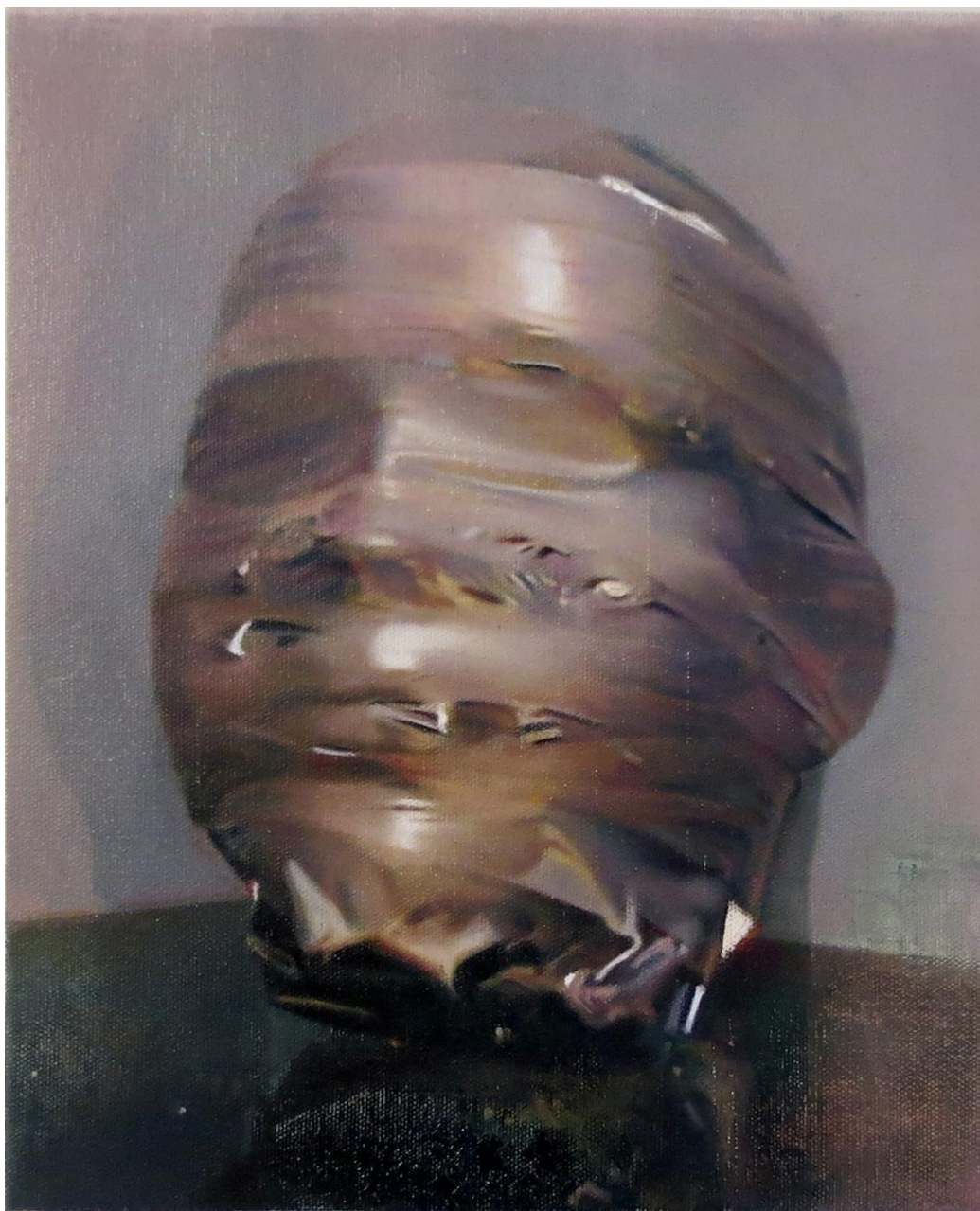
En la esquina , 2022 Óleo sobre loneta de algodón 25 x 31 cm/ 9.8 x 12.2 in