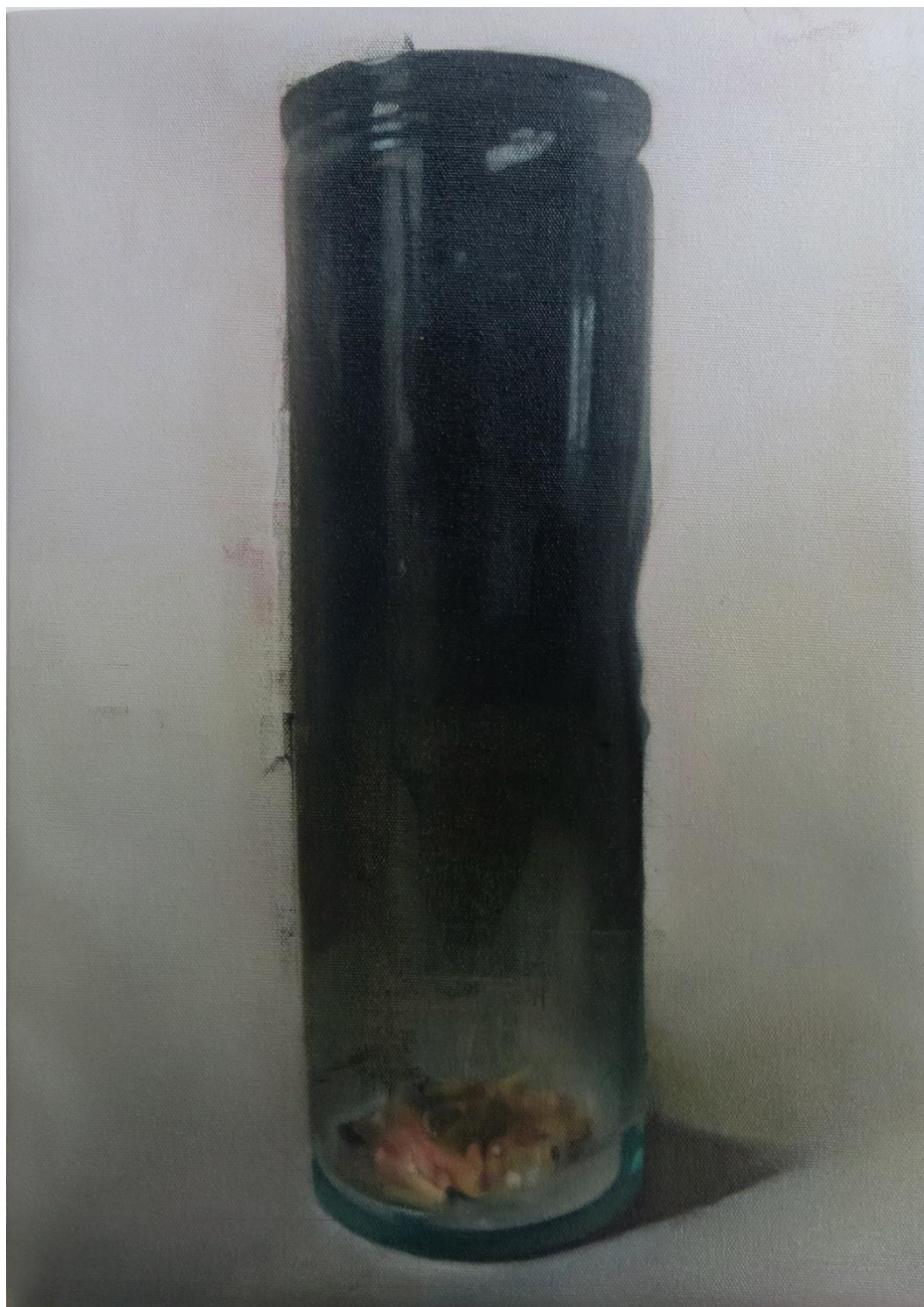
Obsidiana , 2023 Óleo sobre tela 31 x 44 cm/ 12.2 x 17.3 in