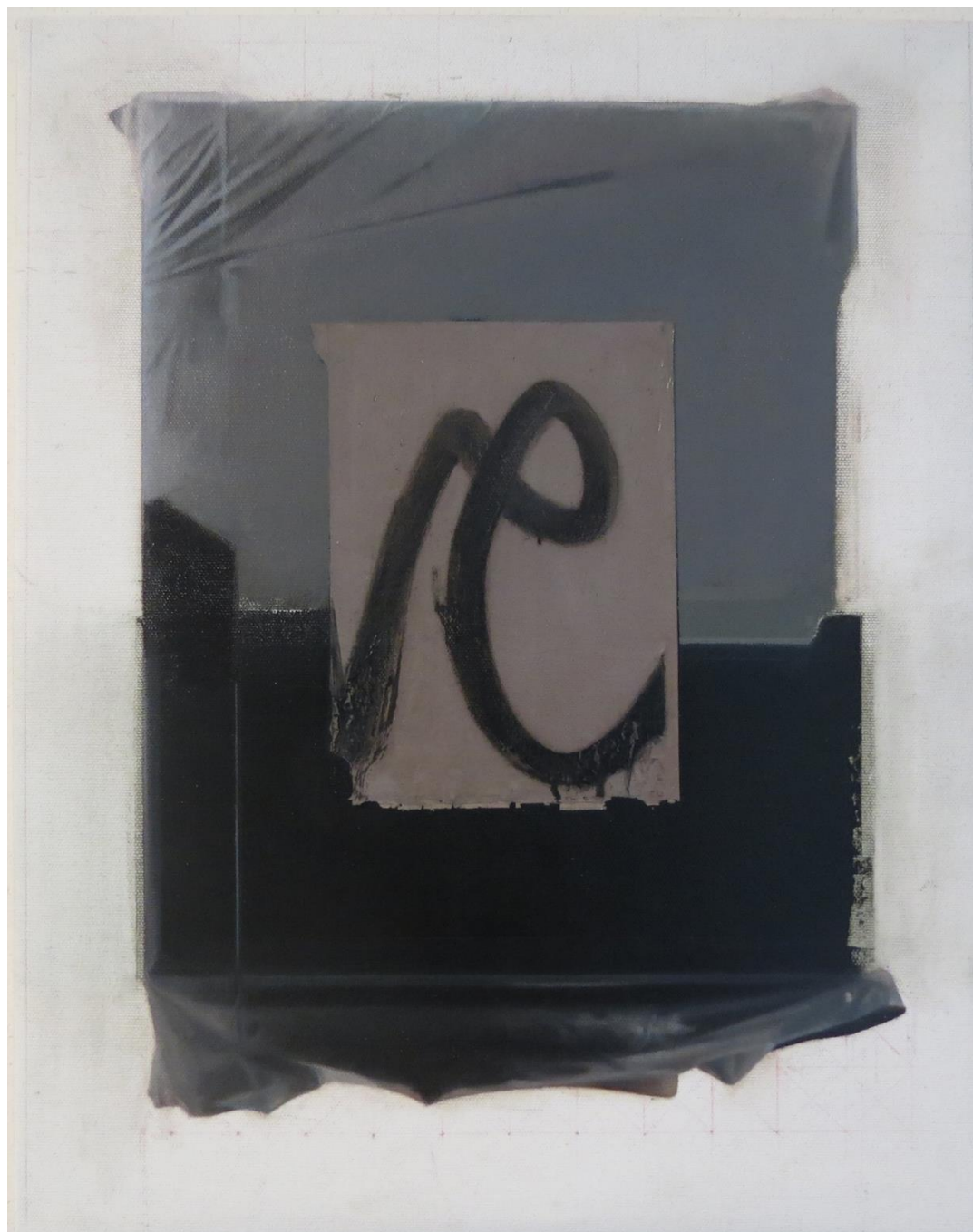
C, 2023 Óleo sobre tela 33.5 x 43.5 cm/ 13.2 x 17.1 in