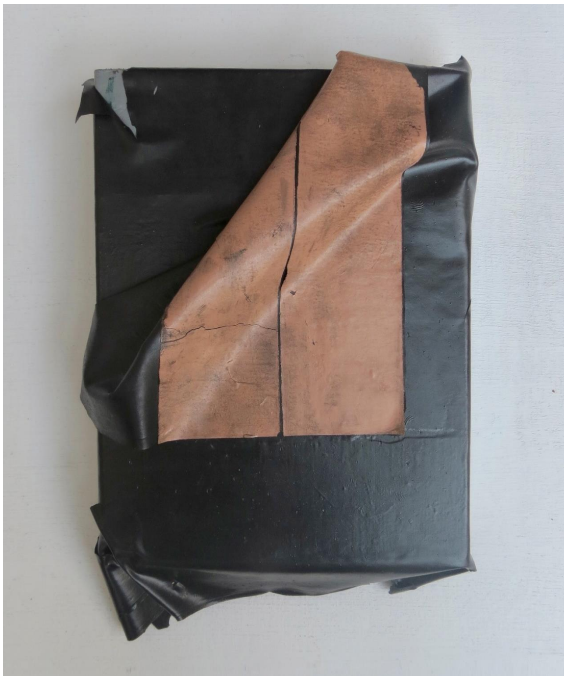
Doble fondo 4, 2023 Óleo sobre tabla 20 x 15 x 2 cm / 7.8 x 5.9 x 0.7 in