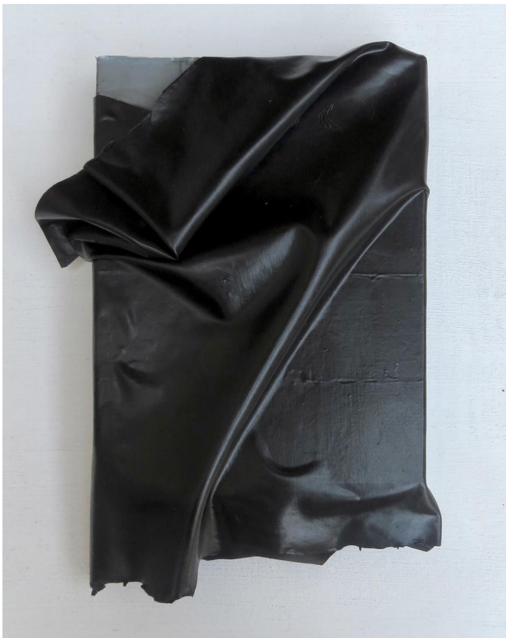
Doble fondo 3, 2023 Óleo sobre tabla 20 x 15 x 2 cm/7.8 x 5.9 x 0.7 in