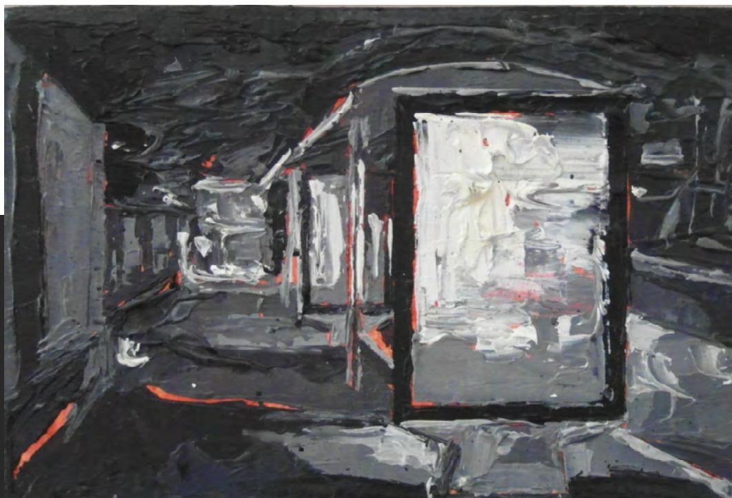
Seis sesiones, 2019