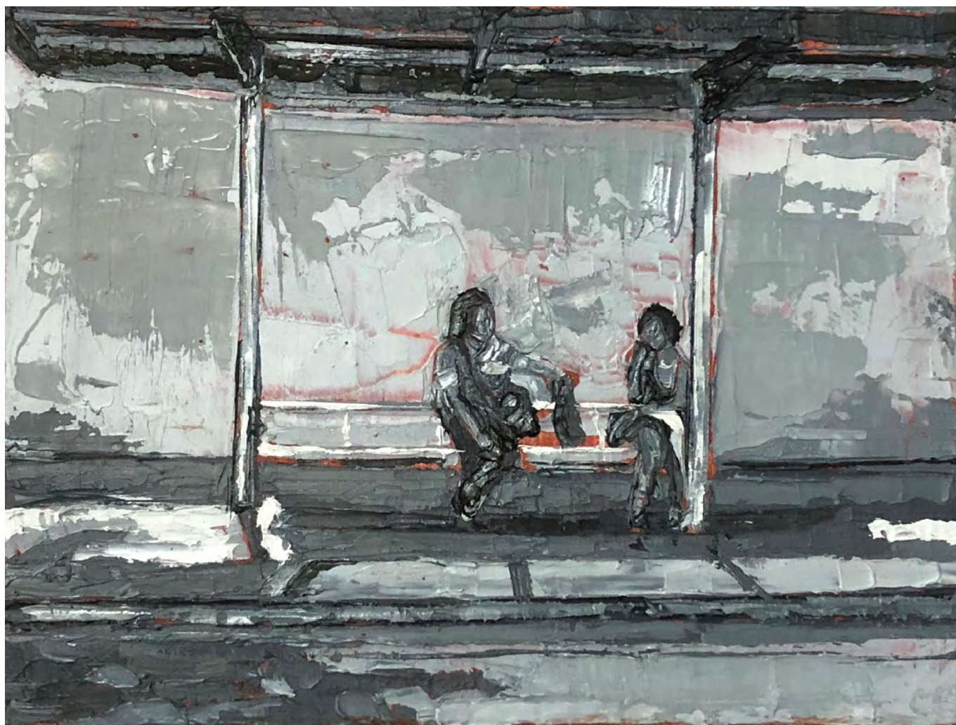
Sin título , 2020 Óleo sobre tela 15 x 20 cm / 5.9 x 7.9 in