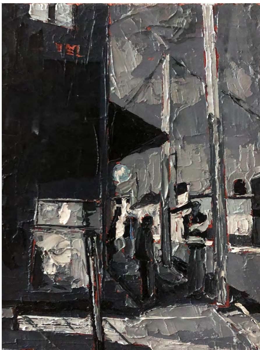
Sin título, 2020