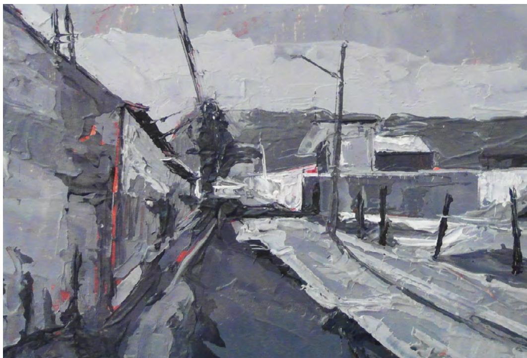
Seis sesiones , 2019