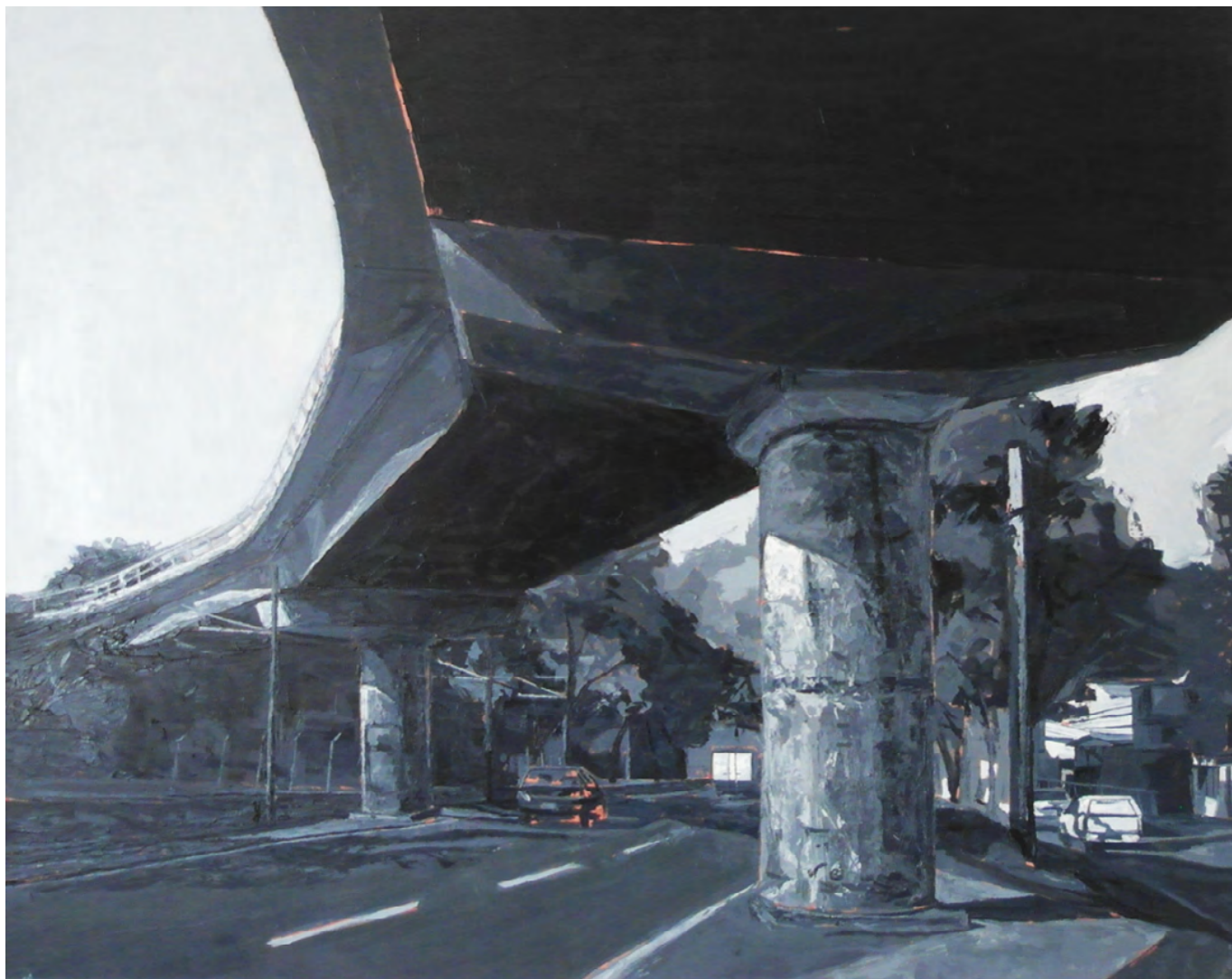
“Espacio para monumentos”, 2016