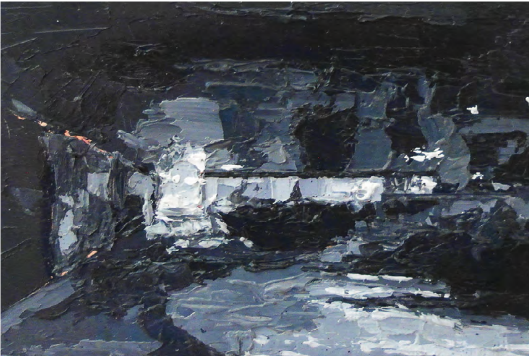
Seis sesiones, 2019