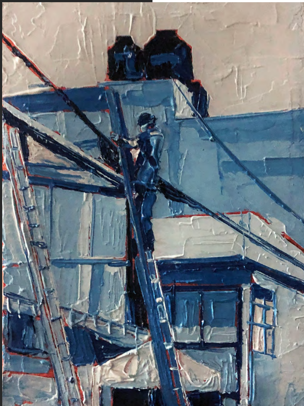
Sin título , 2020 Óleo sobre tela 15 x 20 cm / 5.9 x 7.9 in