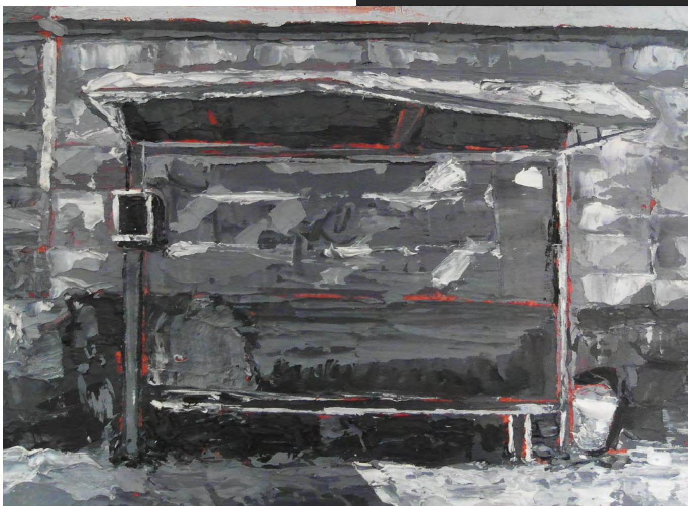
Sin título , 2020 Óleo sobre tela 15 x 20 cm / 5.9 x 7.9 in