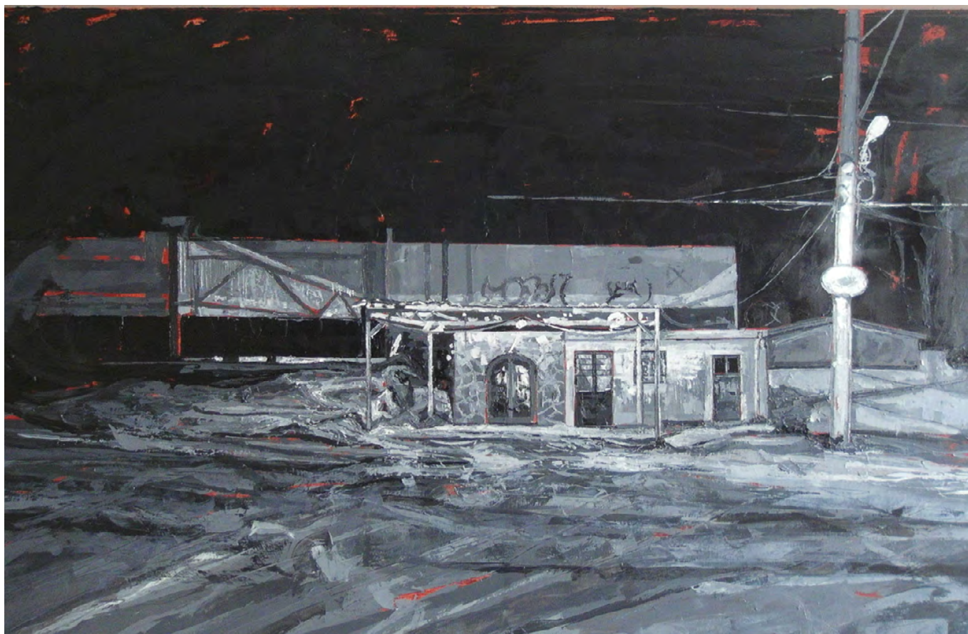
“Base de taxis (Serie Noche Oleosa)” , 2021