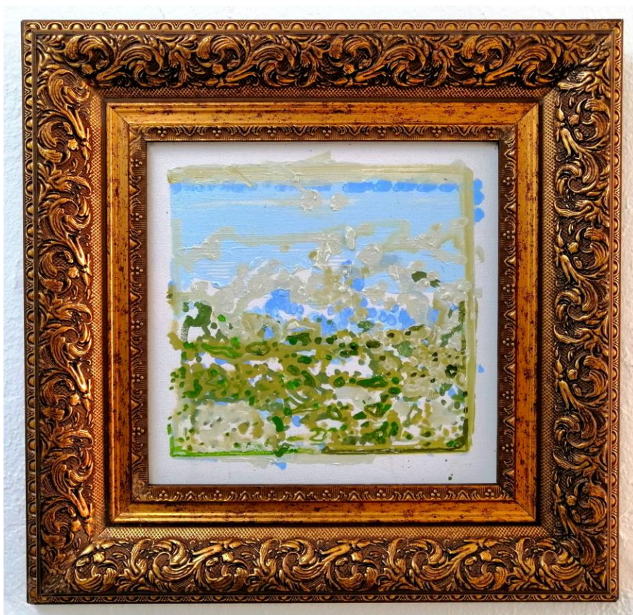
Viajando por un bosque , 2021 Paisaje hecho por una red neuronal y pintado por una máquina CNC al óleo 27 x 27 cm, con marco 45.5 x 45.5 cm / 10 5/8 x 10 5/8 in, con marco 18 x 18 in