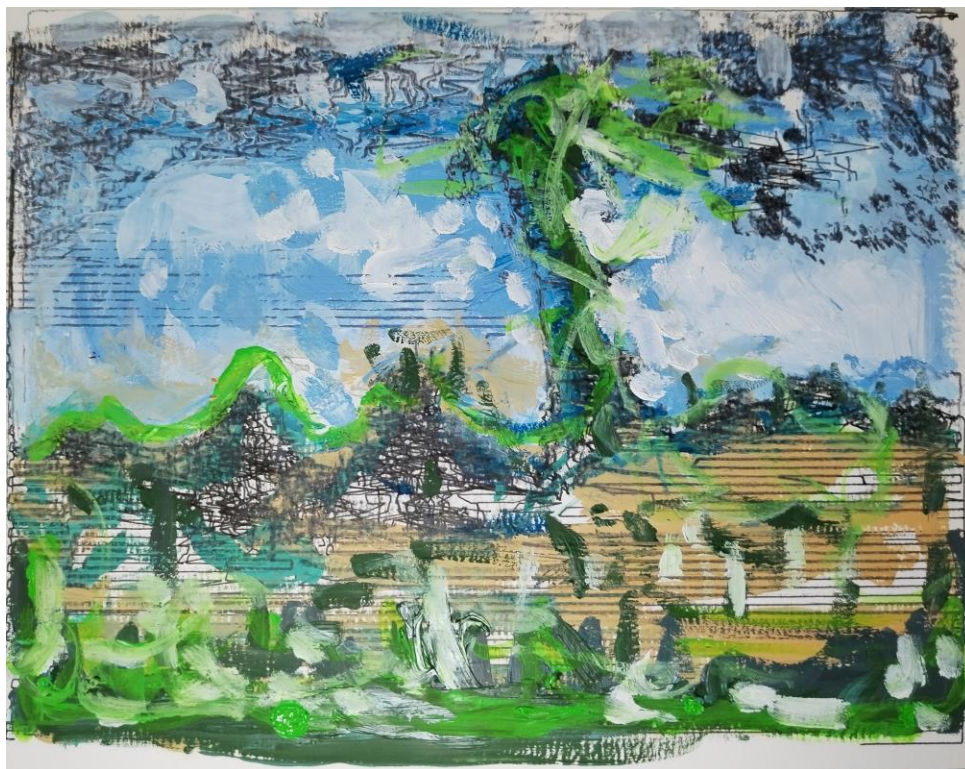
Sin Título , 2022 Óleo y grafito sobre papel 19 x 24.5 cm / 7 ½ x 9 5/8 in