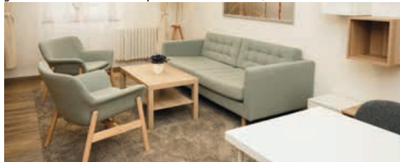
Nové komfortně a neformálně vybavené Centrum náhradní rodinné péče na krajském úřadě.