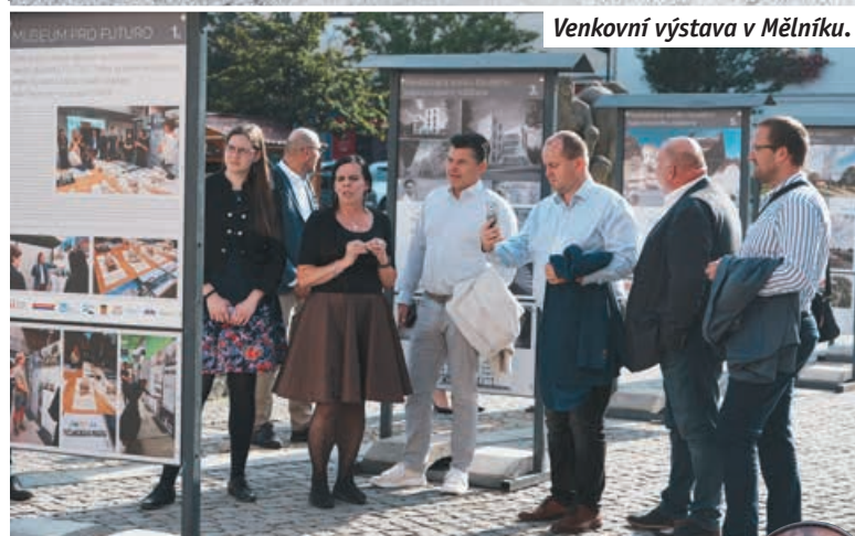
Venkovní výstava v Mělníku.