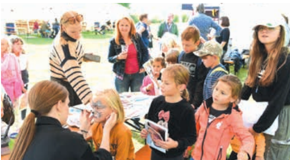
Kraj dlouhodobě podporuje pěstouny. Jako poděkování uspořádal společné setkání v Mirakulu.

je přesvědčení, že o děti se může postarat pouze manželský pár. Pěstounem se ale může stát každý, kdo má dost odvahy, síl, hlavně ale ten, kdo je pevně rozhodnut pomoci potřebnému dítěti, dát mu svou lásku a zázemí. Pěstouny se mohou stát také například stejnopohlavní páry.