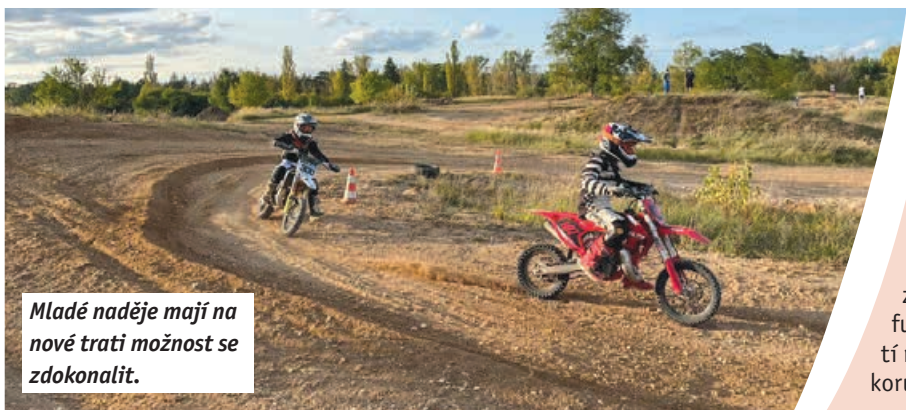
Mladé naděje mají na nové trati možnost se zdokonalit.