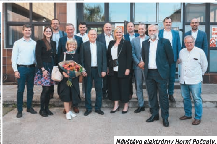
Návštěva elektrárny Horní Počaply.