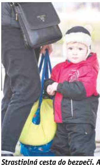
Strastiplná cesta do bezpečí. Autobusy Středočeského kraje převezly z hranic stovky volyňských Čechů, kteří uprchli z oblasti Žitomíru.