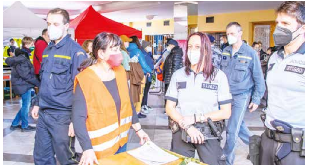
A samostatně v Kutné Hoře, Mladé Boleslavi a Příbrami. Všechna pomáhají uprchlíkům nonstop.