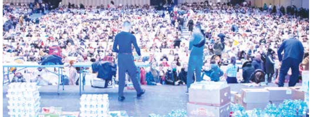
Nejdříve společné centrum s Prahou, které se nakonec stěhovalo do Kongresového centra.