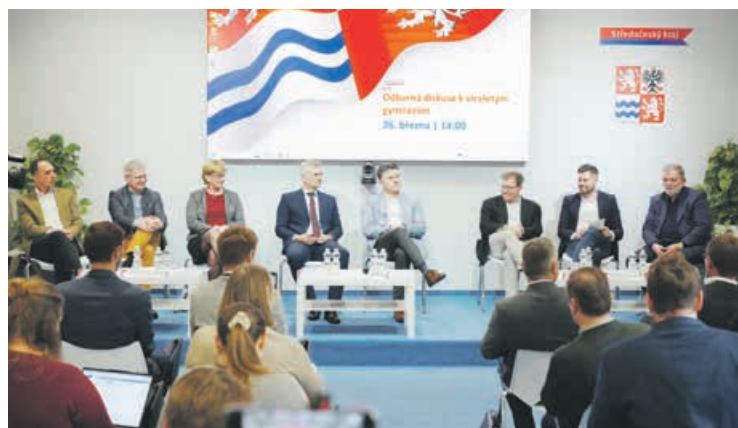
Debaty o roli víceletých gymnázií se zúčastnila řada odborníků.