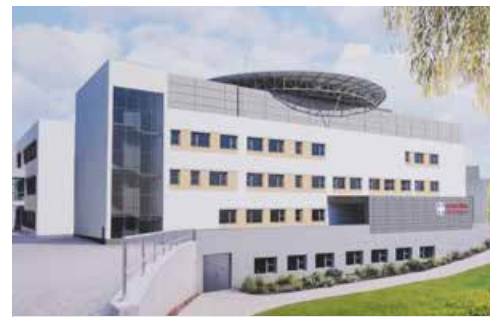
Vizualizace nového pavilonu urgentního příjmu kolínské nemocnice.

Hlavním přínosem nového urgentního příjmu bude podle vedení nemocnice výrazné zrychlení péče o pacienty. Ti dnes často musí procházet různými částmi areálu, než se dostanou k definitivnímu ošetření. Nově budou soustředěni na jednom místě, což zkrátí dobu od příchodu k zahájení léčby. Týká se to jak