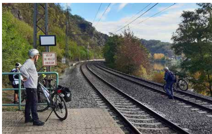
Současný stav „stezky“ je v těchto místech dost nebezpečný.

Nová trasa není jen lokální „asfaltkou“. Je součástí evropské magistrály EuroVelo 7, která spojuje Norsko s Maltou. Díky evropským dotacím, které pokryjí skoro polovinu nákladů, se sen o souvislé cyklistické tepně podél Vltavy stává realitou. Pokud půjde vše podle plánu, v létě 2029 už budeme sviššet z Prahy do Mělníka s větrem v zádech a v naprostém bezpečí.