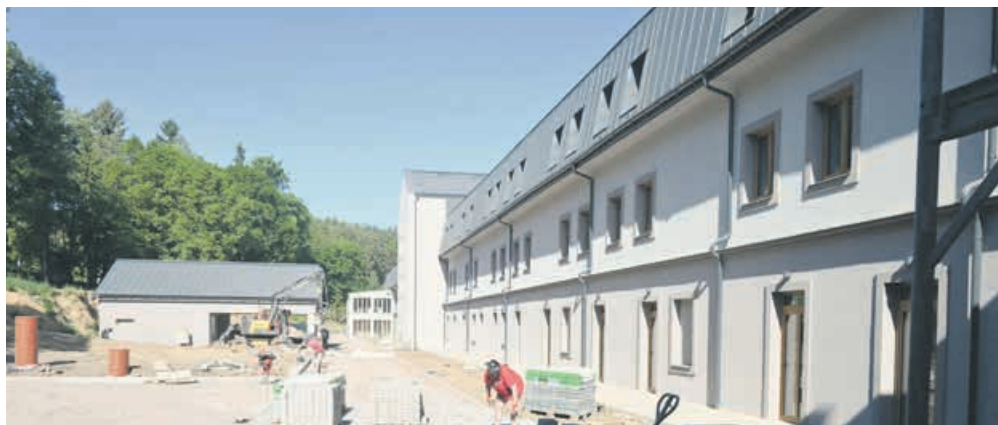
Stavba se blíží do finále. Do nového zařízení v Březnici se klienti přestěhují ještě letos.

sociálních věcí v úzkém kontaktu s rodinnými příslušníky a také se samotnými klienty domova. Aby se předešlo nepřesnostem nebo nepravdivým informacím, uskutečnilo se na konci května společné jednání kraje s rodinami. Středočeský kraj bude maximálně zohledňovat individuální přání klientů, aby přesun do jiných domovů s moderním zázemím proběhl co nejhladším způsobem. „ Velmi detailně a otevřeně jsme všem na místě vysvětlili, co bude přesun obnášet a proč jsme se tak rozhodli učinit. Ve veřejném prostoru se bohužel začaly šířit polopравdy a nepřesnosti, které mohly být pro některé rodiny matoucí. Naštěstí se nám podařilo situaci uklidnit, vše probrat a najít společnou shodu na tom, že tento krok je zkrátka potřeba. Ze setkání mám velmi dobrý pocit a děkuji všem rodinám za jejich skvělý přístup. A navíc je důležité také zmínit, že přesun jinam nebude pro nikoho znamenat zdražení pobytu ani služeb, “ uzavírá radní Martin Hrabánek.