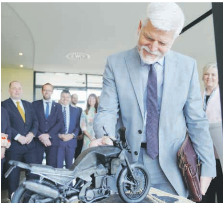
Prezident Petr Pavel dostal kovaný model své motorky.

Výsledkem jejich pět týdnů trvající práce byla celooceľová replika motorky umístěná na kovaném reliéfním podkladu ve tvaru mapy České republiky. Symbolicky tak spojuje středočeské řemeslo s cestami, které prezident během svého mandátu podniká napříč republikou při setkáních s lidmi