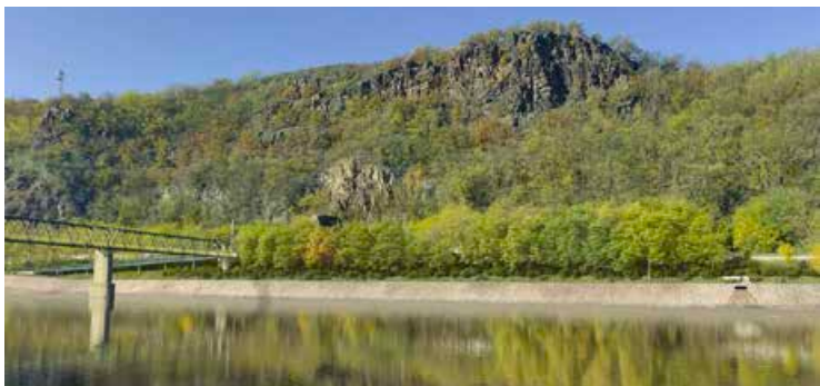
Vizualizace nové cyklostezky za půl miliardy.

Milovníci dvou kol, zbystrěte. Cesta z metropole k soutoku Vltavy a Labe už brzy nebude připomínat boj o přežití v terénu. Středočeský kraj totiž rozsekl „gordický uzel“ severně od Prahy a schválil přípravu stavby technicky nejnáročnějšího úseku Vltavské cyklostezky mezi Úholičkami a Libčicemi.