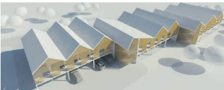
Vizualizace komunitního bydlení ve Zdicích.

Pro kraj jde o strategickou investici. Nejenže se lokalita nachází v místě ideálním pro zástavbu s výbornou dopravní dostupností, ale díky důslednému vyjednávání se podařilo dosáhnout výrazné úspory. Kupní cena byla oproti znaleckému posudku snížena o bezmála dva miliony korun.