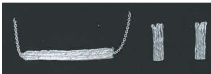
Šperky z ateliéru Hany Beskyd Polívkové.

Šperky jsou vyrobeny ze stříbra a vznikají ručním stáčením jemných měděných nití, které jsou následně odlévány metodou ztraceného vosku. Inspirací je příroda, pole a koloběh života – motivy, které připomínají pomíjivost okamžiku, naději i drobné zázraky přírody. Práce Hany Beskyd Polívkové byly představeny na řadě českých i zahraničních výstav.