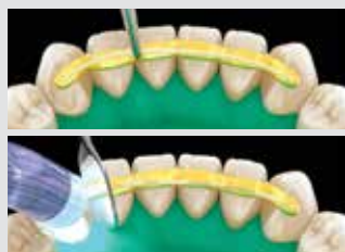
6. Placer la fibre et photopolymériser chaque dent pendant 5 à 10