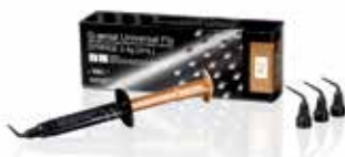
GC G-ænial® Universal Flo