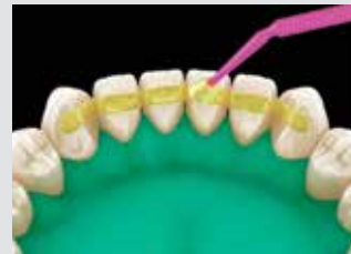
4. Coller et photopolymériser