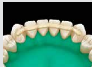
8. Photopolymériser pendant 40 secondes par dent et effectuer la finition