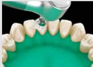
2. Nettoyer les dents