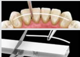
1. Mesurer et couper la fibre.

... pour créer une rétention orthodontique esthétique