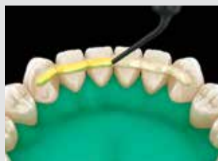
7. Recouvrir avec le composite fluide