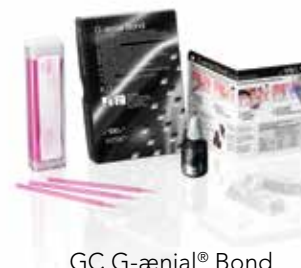
GC G-ænial® Bond