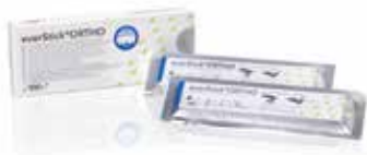
900831 everStickORTHO 2x12cm refill