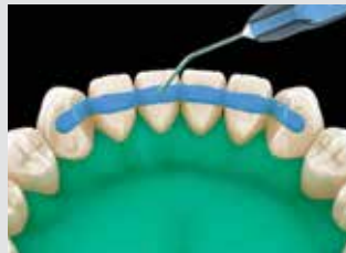
3. Mordancer la zone à coller pendant 45 à 60 secondes