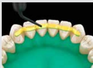
5. Appliquer le composite fluide ; ne pas photopolymériser