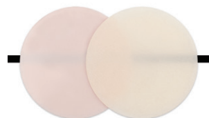
PO (Pink Opaquer) / A1 kleur OVERLAPPEND

Nu kunt u voorkomen dat donkere gebieden uw esthetische resultaten bederven.