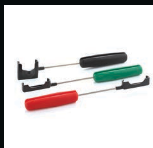
Manches type brosse à dents

Nos accessoires sont les compléments parfaits du système RVG 5200 et permettent d'optimiser le traitement des images. Les capteurs sont fournis avec un kit d'échantillons d'enveloppes hygiéniques jetables, des positionneurs et des supports de montage.