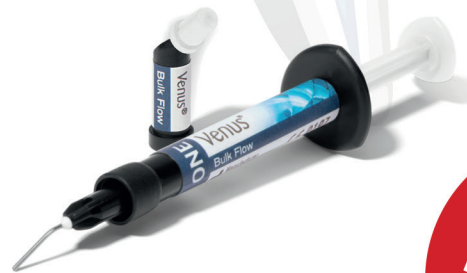
Hoge radiopaciteit zorgt voor een be- trouwbare diagnose