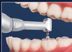
Tête et col de contre-angle normaux