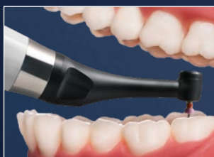
Contre-angle CanalPro X-Move avec une tête minuscule et un col mince