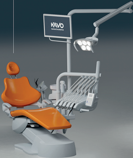
KaVo ESTETICA E30