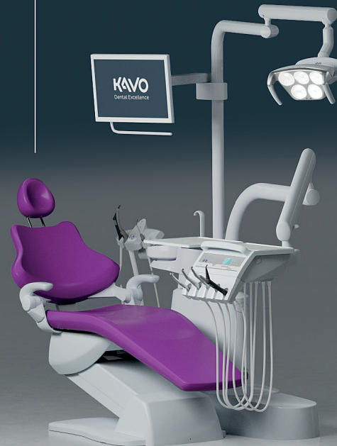
KaVo Primus 1058 Life