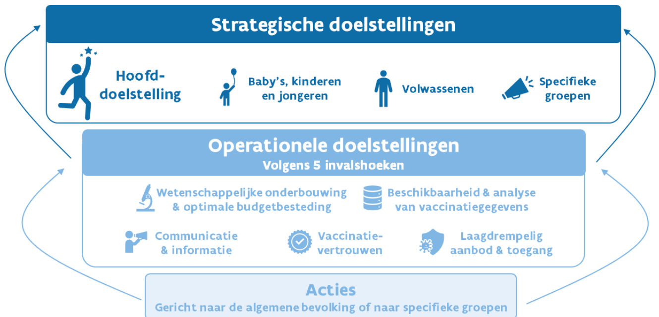
Figuur 3.3 Structuur van de gezondheidsdoelstelling Vaccinatie