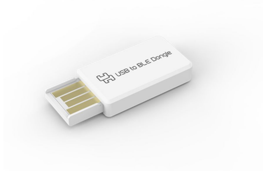
2 블루투스 Dongle