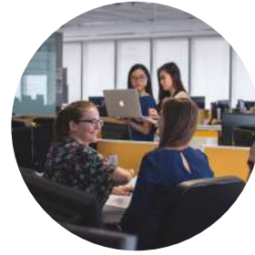
Un groupe de 30 experts et de partenaires