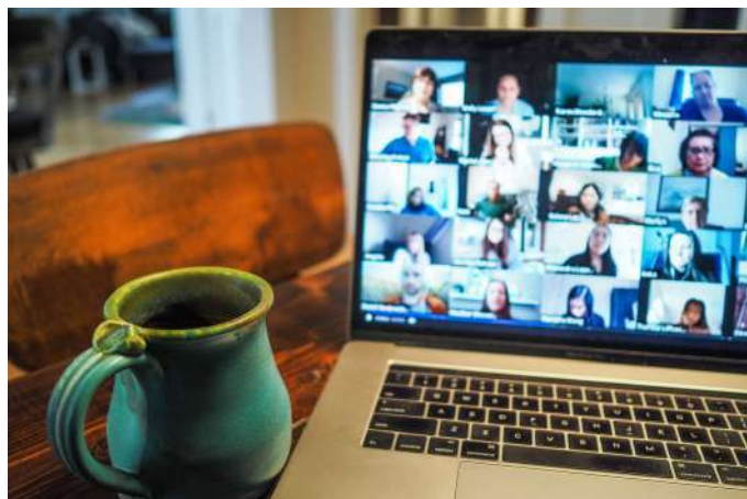
Table ronde pour le lancement du programme L(Créent)

Afin d'inaugurer le lancement de la deuxième édition du programme L(Créent), une table ronde "Vive de sa passion est-ce possible ?" a été organisée le 25 février en distanciel.