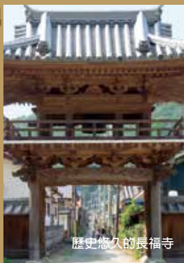
歷史悠久的長福寺

星期六和星期日和節假日，遊客和三五成群的當地人都回來參觀獨特建築的武家屋和詩人野口雨情所鍾情的旅館。享受詩情畫意，別有情趣的田園生活。