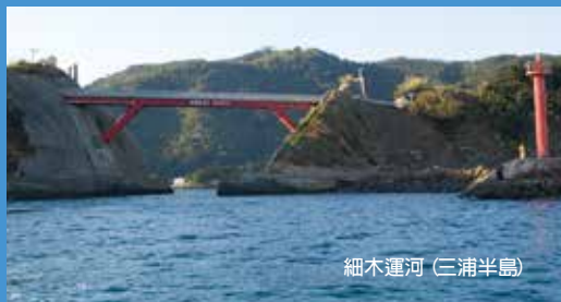
細木運河（三浦半島）

在宇和島和鄰島之間有船隻供旅遊專用，快速船每日六航次，普通船每日一航次。可以欣賞宇和海特有的絕佳景點和享受巡航之旅。