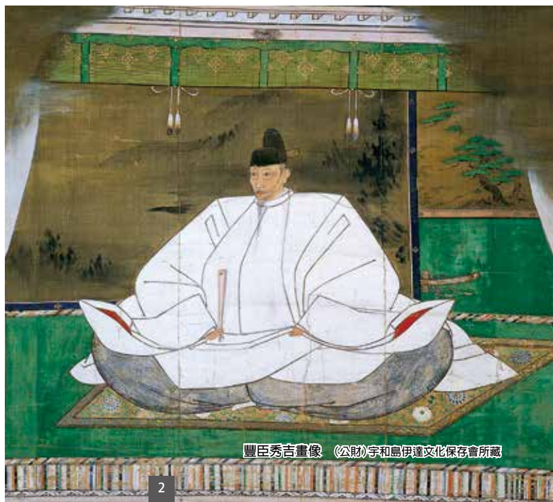
豐臣秀吉畫像（公財）宇和島伊達文化保存會所藏

在伊達家浜御殿里，展示了伊達藩主在統治宇和島250餘年之中，重要的古文獻，武器盔甲，婚禮禮品等物品。可以鑑賞到有古老文化的大名名品。