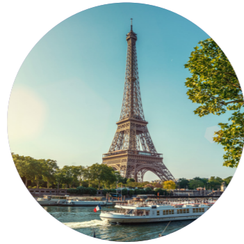
Paris 11 mars