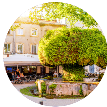
Salon-de-Provence 17 septembre