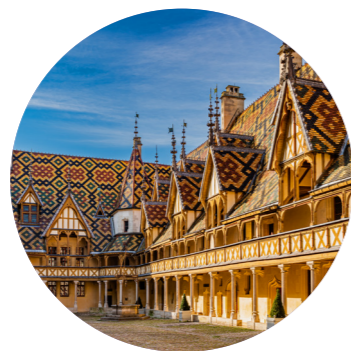
Dijon 02 octobre