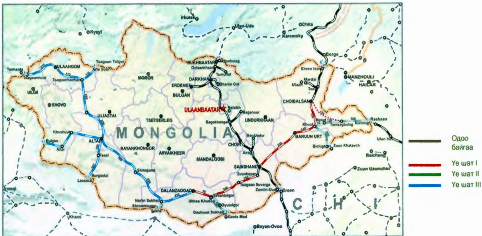
Зураг 2. “Шинэ төмөр зам төсөл”-ийн төлөвлөгөө

Төрөөс төмөр замын тээврийн талаар баримтлах бодлого (УИХ 2010 оны 32 дугаар тогтоол)-д заасан I, II үе шатанд барих төмөр замын суурь бүтцийн “барих-ашиглах-шилжүүлэх” чиг үүргийн дагуу дараах төмөр замын суурь бүтэц барих төслүүдийг хэрэгжүүлж, дотоодын төмөр замын сүлжээг нэмэгдүүлж, төмөр замаар ачаа тээвэрлэх хүртээмжийг нэмэгдүүлнэ.