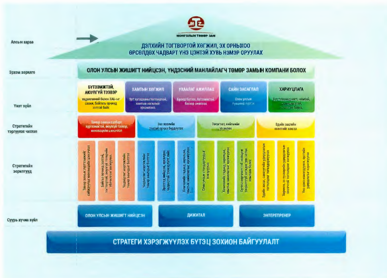
Зураг 1. Монголын төмөр зам ТӨХК-ийн алсын хараа, эрхэм зорилго, стратегийн зорилтууд

Менеджментийн нэгдсэн олон улсын стандартуудыг хэрэгжүүлэгч, төмөр замын салбарын дэвшилтэт технологийг нэвтрүүлсэн, мэргэшсэн албан хаагчидтай төмөр замын хөгжлийн тодорхойлогч компани болохын тулд дараах төлөвлөгөө стратегийг хэрэгжүүлнэ.