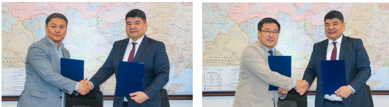
Зураг 12. Баруун, Зүүн босоо чиглэлийн төмөр замын төслүүдийн хөрөнгө оруулагч талуудын хамт (2023.06.15)

“Хөгжлийн сэргэлт” Зам, тээврийн салбарын залуучуудын зөвлөгөөн 2023 оны 06 дугаар сарын 23-ны өдөр зохион байгуулагдаж “Монголын төмөр зам” ТӨХК-ийн төлөөлөл оролцов.