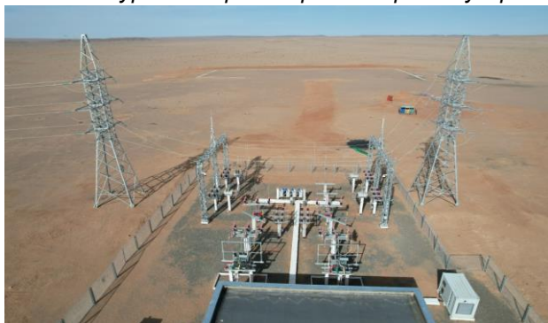
Зураг 2. Эрчим хүчний барилга угсралтын ажил дуусч байнгын хүчдэлд залгасан байдал

Тавантолгой-Зүүнбаян чиглэлийн төмөр замын дагуух Эрчим хүчний барилга угсралтын ажил дууссантай холбоотойгоор Эрчим хүчний сайдын А/112 тушаалаар байгуулагдсан улсын комисс Цагаансуварга дэд станц, Зүүнбаян дэд станц, хоёр хэлхээт 35 кВ-ын 455.5 км ЦДАШ Хоорондын замын бааз станц болох АТП маягийн 14 ширхэг 35/0.4 кВ-ын дэд станцуудад ажиллаж, гишүүдийн 100%-ийн саналаар байнгын хүчдэлд залгасан.