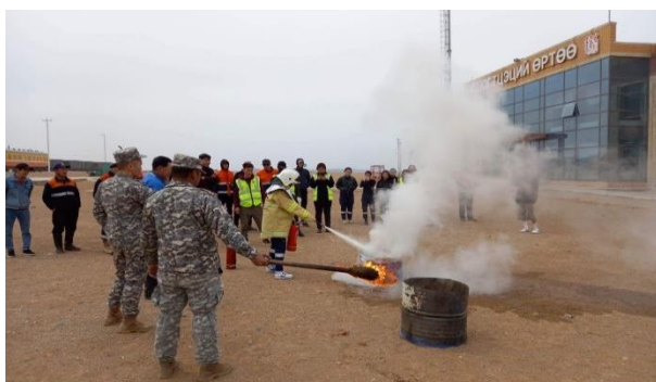
Зураг 7. Гамшгаас хамгаалах сургалт (2023.05.08)

Цогтцэций зангилааны өртөө, зөрлөгт галын аюулгүй байдал, анхны түргэн тусламжийг үзүүлэх сургалтыг Өмнөговь аймгийн Онцгой байдлын газартай хамтран зохион байгуулж нийт 263 ажилтныг хамруулсан. MNS 5566:2020 стандартын дагуу аж ахуйн нэгж байгууллага, барилга байгууламжид гал унтраах анхан шатны багаж хэрэгслийн зайлшгүй байх шаардлага, нормын дагуу Цогтцэций зангилааны өртөө, зөрлөгт 4кг-н галын хор 82ш, 20кг-н галын хор 2ш, бие даан гал унтраах төхөөрөмж 19 ширхэгийг тус тус байршуулав.