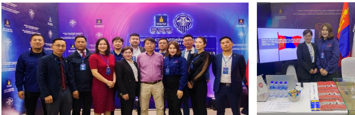
Зураг 11. “Зам, тээврийн салбарын хөрөнгө оруулалтын чуулга уулзалт (2023.06.09)

Засгийн газрын 2022 оны 116 дугаар тогтоолын дагуу “Монголын төмөр зам” ТӨХК нь Баруун босоо чиглэлийн төмөр замын төслийн хөрөнгө оруулагч “Эссенз саплайз” ХХК, Зүүн босоо чиглэлийн төмөр замын төслийн хөрөнгө оруулагч “Ийст корридор рэйлрөүд” ХХК-иудтай тусгай зориулалтын “Арцсуурь-Нарийнсухайт-Шивээхүрэн төмөр зам” ХХК, “Чойбалсан-Хөөт-Бичигт төмөр зам” ХХК-ийг байгуулах Хувьцаа эзэмшигчдийн гэрээг тус тус байгуулав.