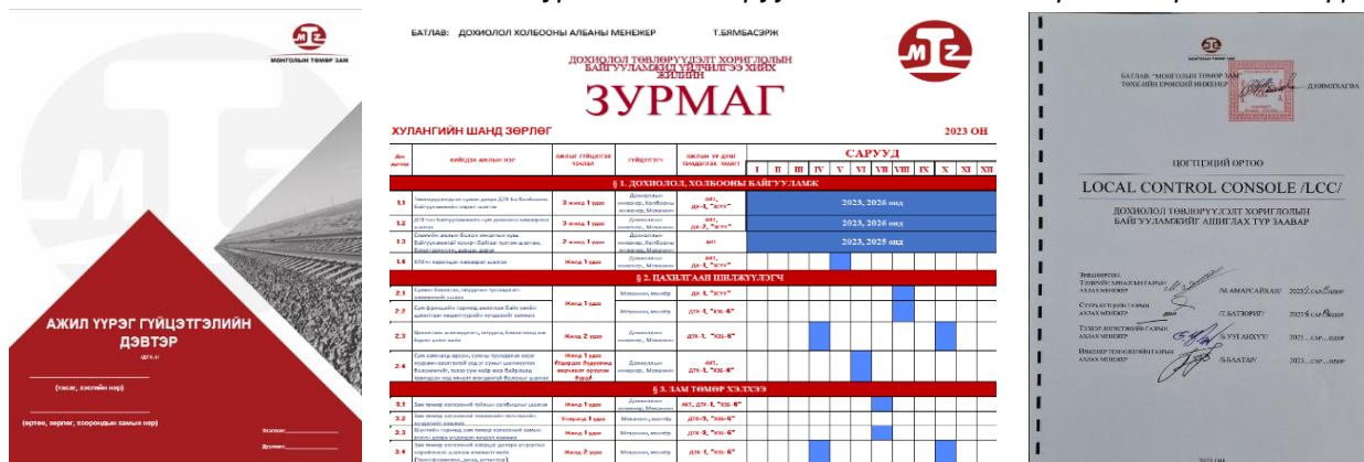
Зураг 4. Боловсруулсан ашиглалтын үеийн баримт бичгүүд

Дохиолол холбооны эд хөрөнгийн түрээсийн тарифыг Гүйцэтгэх захирлын 2023 оны 05 дугаар сарын 08-ны өдрийн А/73 тоот тушаалаар баталсан.