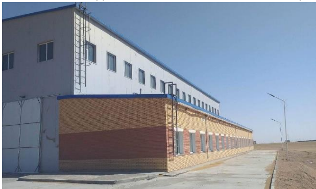
6 Зураг 1. Зэхэлтийн депогийн барилга, зам засварын барилга, уурын зуухны барилга

Зам засварын барилга, уурын зуухны барилгад Улсын комиссын гишүүдийн үүрэг даалгавар болон дахин засварлаж, ашиглалтын шаардлага хангуулах зорилгоор 2023 оны 2 дугаар сарын 7-ны өдөр захиалагч, ашиглагч, гүйцэтгэгч нарын хамтарсан үзлэгийг зохион байгуулж, үзлэг шалгалтын явцад гарсан зөрчил, дутагдалтай ажлууд болон дулааны улиралд хийж гүйцэтгэх нийт 10 ажилд акт үйлдэж, Зэвсэгт хүчний 338-р анги 2023 оны 05 сарын 04-ний өдрөөс 2023 оны 06 сарын 05-ны хооронд тухайн ажлуудыг гүйцэтгэж ашиглагчид актаар хүлээлгэн өгсөн.