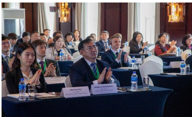
Зураг 9. “Зүүн Азийн төмөр замын холболтыг бэхжүүлэх тухай олон улсын семинар”. (2023.04.05-ны өдөр)

Зам, тээврийн хөгжлийн яам, Солонгосын KOTI байгууллагын хамтран зохион байгуулсан “Зүүн Азийн төмөр замын холболтыг бэхжүүлэх тухай олон улсын семинар”-т оролцов.