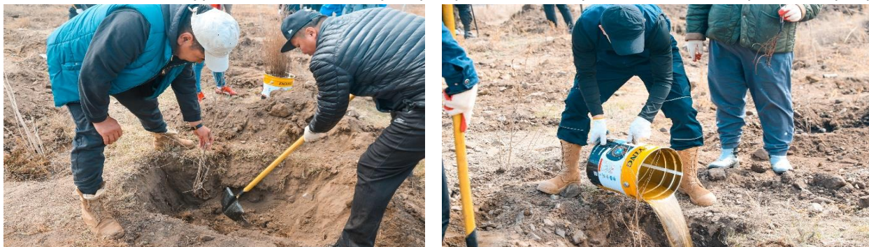
Зураг 5. 2023 оны 05 дугаар сарын 13-ны өдөр Үндэсний мод тариалах өдрөөр

“Тэрбум мод” үндэсний хөдөлгөөний хүрээнд тарьц, суулгацын нөөц бүрдүүлэх зорилгоор “Агро форест” ХХК-тай 33,000 модны суулгац нийлүүлэх гэрээ байгуулан хамтран ажиллаж байна. Хөшигийн хөндийн хурдны зам дагуу Өлзийт хороололд 200 ширхэг мод, Цогтцэций өртөөнд 2000 ширхэг мод суулгав.