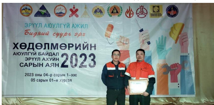
Зураг 6. “Хөдөлмөрийн аюулгүй байдал, эрүүл ахуйн аян 2023”

“Хөдөлмөрийн аюулгүй байдал, эрүүл ахуйн аян 2023”-ны хүрээнд Цогтцэций зангилаа, Төмөртэй өртөөний зам паркаар явах аюулгүйн замналыг боловсруулан баталгаажуулж, Хөдөлмөрийн аюулгүй байдал, эрүүл ахуйн булан, ажлын өрөө тасалгааны тохижилтыг сайжруулж ажилласан. ХАБЭА-н хуулийн талаар “АХА” тэмцээнийг ажилтнуудын дунд зохион байгуулж, ажилтнуудын эрүүл, идэвхитэй амьдралын хэв маяг, эрүүл мэндэд анхаарч спорт заал түрээсийн гэрээ байгуулж ажиллав.