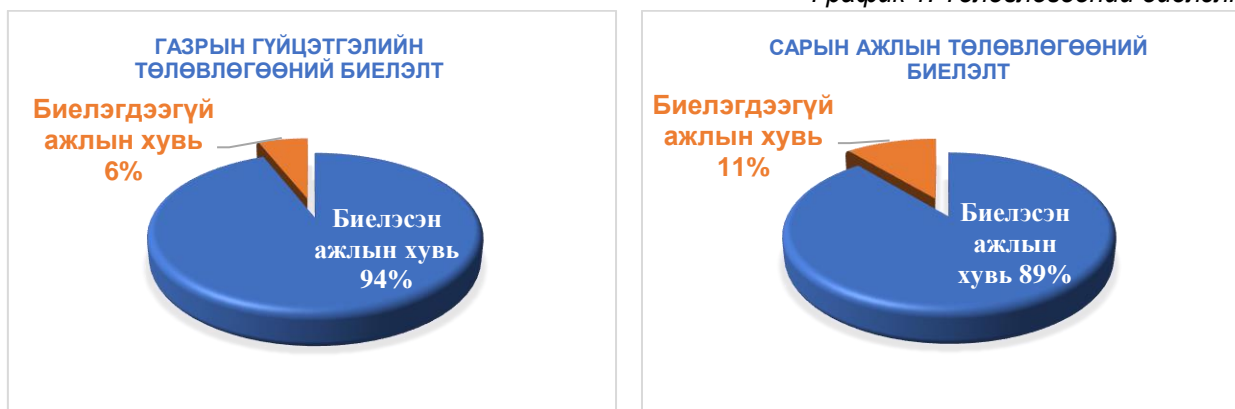
График 1. Төлөвлөгөөний биелэлт

Мөн газрын хэмжээнд Галт тэрэгний хөдөлгөөний аюулгүй байдлыг хангах чиглэлээр сар бүр төлөвлөгөө гарган 89%-ийн биелэлтэй хэрэгжүүлж ажилласан.