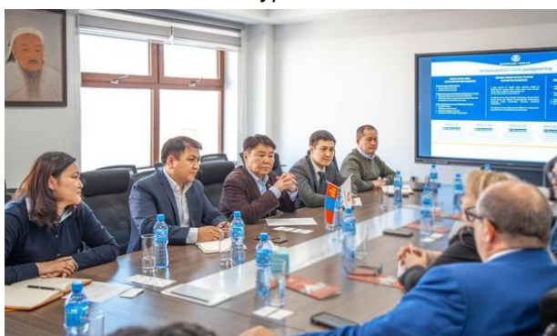
Зураг 10. АНУ-ын Холбооны төмөр замын төлөөлөгчдийн хамт(2023.04.25)

2023 оны 04 дүгээр сарын 25-ны өдөр АНУ-ын Тээврийн Яамны Олон улсын тээвэр, худалдааны албаны Ази, Номхон далайн ахлах менежер, Холбооны төмөр замын захиргааны Олон улсын хөтөлбөрийн захирал, Холбооны төмөр замын захиргааны Судалгаа хөгжил, технологийн албаны Судалгааны хөтөлбөрийн менежер, Холбооны төмөр замын захиргааны Төмөр замын аюулгүй байдлын албаны системийн инженер тэргүүтэй хүндэт төлөөлөгчтэй уулзалт зохион байгуулж, АНУ-ын Холбооны Төмөр Замын Захиргааны Аюулгүй байдлын албаны мэргэжлийн чиг үүрэг, хариуцлага, аюулгүй байдлын хяналт шалгалт, хяналт шалгалтыг хэрхэн хийхийг шийдэх эрсдэлийн үнэлгээ, төмөр замын аюулгүй байдал, төмөр замын зохицуулалтын процесс сэдвээр санал солилцсон.