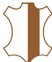
1/2 DOSSET 1.5-4.5 mm