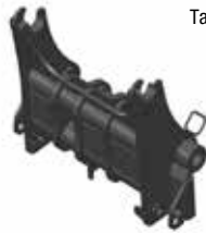
Tablier Quick-Tach (QT)

Description : de construction robuste pour assurer fiabilité et résistance, la fourche à grappin permet de manipuler facilement la ferraille, les déchets, les broussailles et tous les matériaux en vrac difficiles à manier.