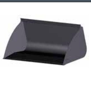
Godet à matériaux légers : pas d'exigence particulière.