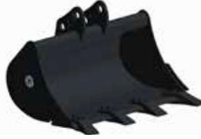
Löffel: Armaturen in Abhängigkeit vom genutzten Kupplungssystem.