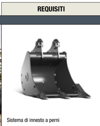
Sistema di innesto a perni