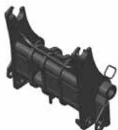
Pinza per benna con denti forgiati