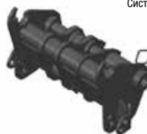
Система несущей рамы Manitou (MT)