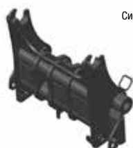
Система Quick-Tach (QT)

Описание. Очень прочный экскаваторный ковш Bobcat идеально подходит для любой работы: от выемки грунта до перемещения материала. Доступны комплектации с зубьями и без.