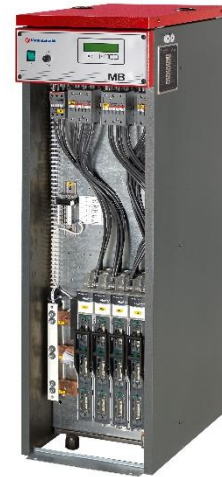
Bildet viser MB 150 kW/230 V

Regulatoren kan tilkobles uteføler for utetemperatur Kompensert varmekurve med justerbar helning og parallell forskyvning. Innebygget trinnbegrensningsfunksjon gjør at kjelen kan begrenses på mindre effekter.