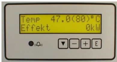
7-trinns elektronisk regulator med mulighet for fjernstyring

Kjelen leveres i effekter 35–150 kW i 230 V, 400 eller 690 V. Driftstemperatur er maks. 100 °C og driftstrykk maks. 6 bar. Kjelen er utstyrt med en elektronisk temperaturregulator med 7 trinn og temperaturområde fra 5 – 100 °C. Regulatoren har display for indikering av bl.a. temperatur, innkoblet effekt, antall innkoblede trinn osv.