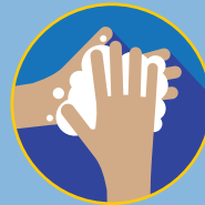
RESTREGAR: POR 20 SEGUNDOS