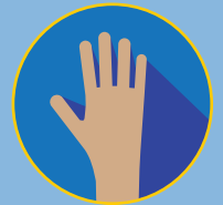
SÉQUESE LAS MANOS