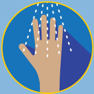
LÁVESE LAS MANOS CON AGUA