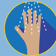
ENJUAGUE SUS MANOS