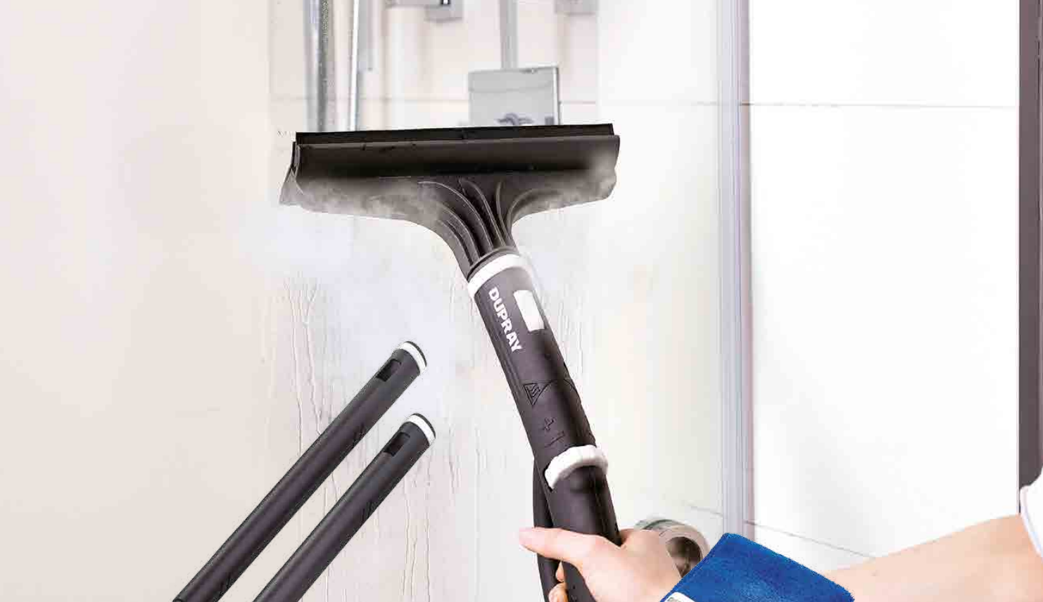
EXTENSION TUBES TUBES D'EXTENSION TUBOS DE EXTENSIÓN VERLÄNGERUNGSRÖHRE