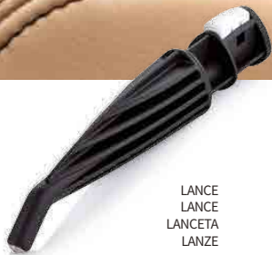
LANCE LANCE LANCETA LANZE