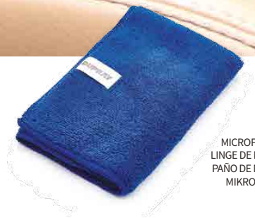
MICROFIBER CLOTH LINGE DE MICROFIBRE PAÑO DE MICROFIBRA MIKROFASERTUCH