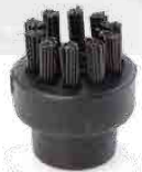
SMALL NYLON BRUSH PETITE BROUSSE DE NYLON PEQUEÑO CEPILLO DE NYLON KLEINE NYLONBÜRSTE