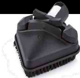
TRIANGULAR TOOL OUTIL TRIANGULAIRE HERRAMIENTA TRIANGULAR DREIECKIGES ZUBEHÖRTEIL