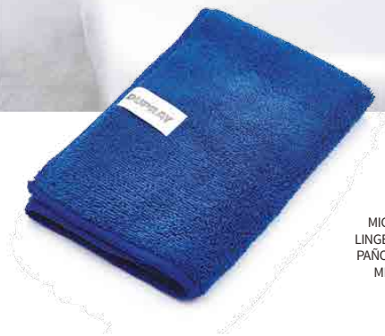
MICROFIBER CLOTH LINGE DE MICROFIBRE PAÑO DE MICROFIBRA MIKROFASERTUCH