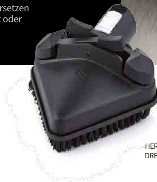
TRIANGULAR TOOL OUTIL TRIANGULAIRE HERRAMIENTA TRIANGULAR DREIECKIGES ZUBEHÖRTEIL

RECOMMENDED TOOLS OUTILS RECOMMANDÉS HERRAMIENTAS RECOMENDADAS EMPFOHLENES ZUBEHÖR