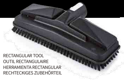
RECTANGULAR TOOL OUTIL RECTANGULAIRE HERRAMIENTA RECTANGULAR RECHTECKIGES ZUBEHÖRTEIL