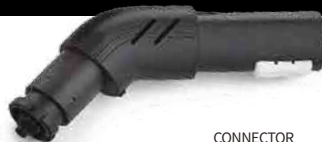
CONNECTOR CONNECTEUR CONECTOR VERBINDUNGSELEMENT

RECOMMENDED TOOLS OUTILS RECOMMANDÉS HERRAMIENTAS RECOMENDADAS EMPFOHLENES ZUBEHÖR