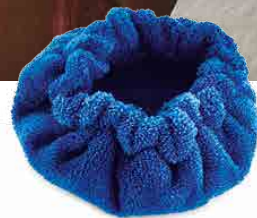
MICROFIBER BONNET BONNET DE MICROFIBRE CAPUCHA DE MICROFIBRA MIKROFASERHAUBE