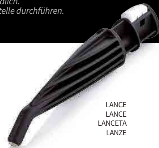
LANCE LANCE LANCETA LANZE