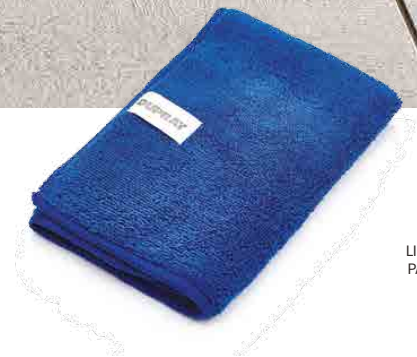
MICROFIBER CLOTH LINGE DE MICROFIBRE PAÑO DE MICROFIBRA MIKROFASERTUCH