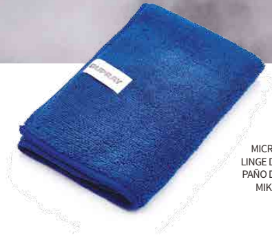
MICROFIBER CLOTH LINGE DE MICROFIBRE PAÑO DE MICROFIBRA MIKROFASERTUCH