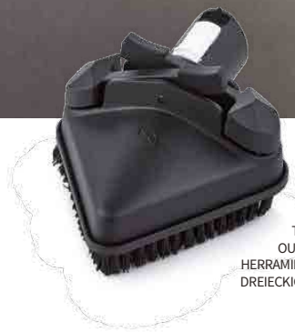
TRIANGULAR TOOL OUTIL TRIANGULAIRE HERRAMIENTA TRIANGULAR DREIECKIGES ZUBEHÖRTEIL