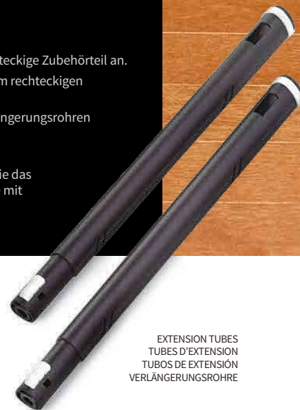
EXTENSION TUBES TUBES D'EXTENSION TUBOS DE EXTENSIÓN VERLÄNGERUNGSRÖHRE