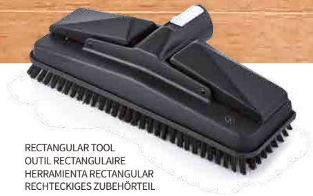
RECTANGULAR TOOL OUTIL RECTANGULAIRE HERRAMIENTA RECTANGULAR RECHTECKIGES ZUBEHÖRTEIL