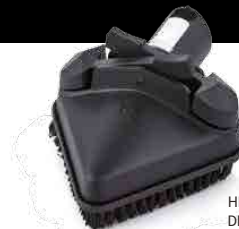
TRIANGULAR TOOL OUTIL TRIANGULAIRE HERRAMIENTA TRIANGULAR DREIECKIGES ZUBEHÖRTEIL