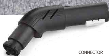
CONNECTOR CONNECTEUR CONECTOR VERBINDUNGSELEMENT