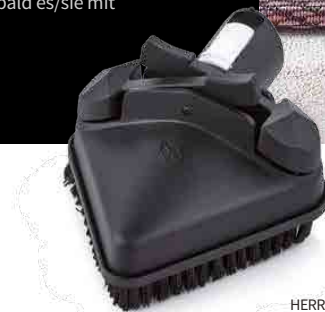
TRIANGULAR TOOL OUTIL TRIANGULAIRE HERRAMIENTA TRIANGULAR DREIECKIGES ZUBEHÖRTEIL

RECOMMENDED TOOLS OUTILS RECOMMANDÉS HERRAMIENTAS RECOMENDADAS EMPFOHLENES ZUBEHÖR