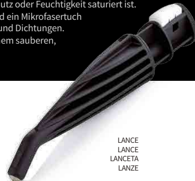
LANCE LANCE LANCETA LANZE