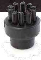
SMALL NYLON BRUSH PETITE BROSSE DE NYLON PEQUEÑO CEPILLO DE NYLON KLEINE NYLONBÜRSTE