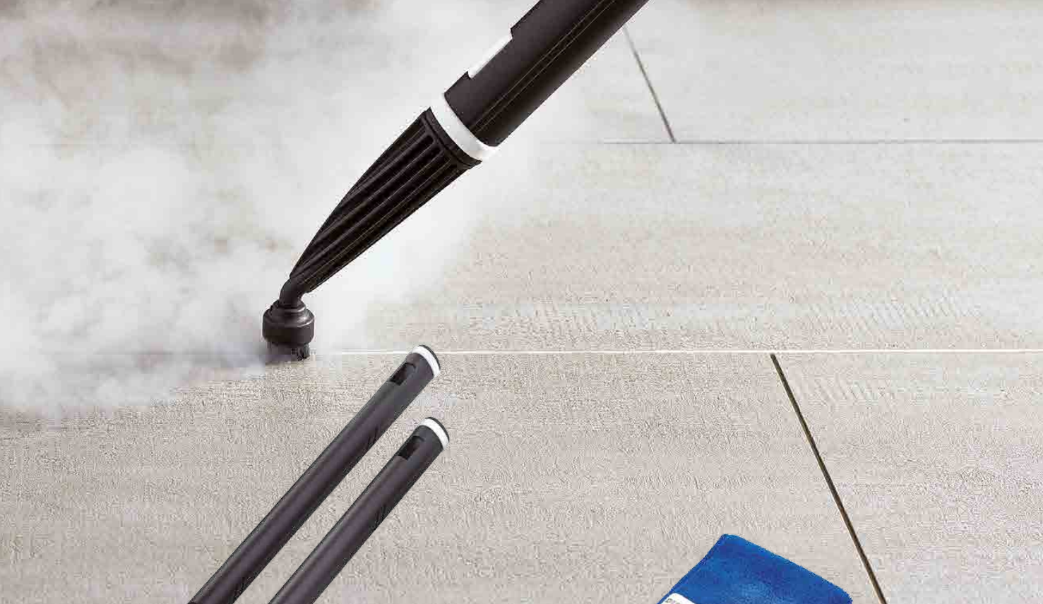
EXTENSION TUBES TUBES D'EXTENSION TUBOS DE EXTENSIÓN VERLÄNGERUNGSRÖHRE