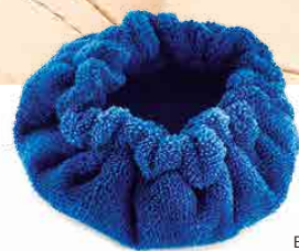
MICROFIBER BONNET BONNET DE MICROFIBRE CAPUCHA DE MICROFIBRA MIKROFASERHAUBE