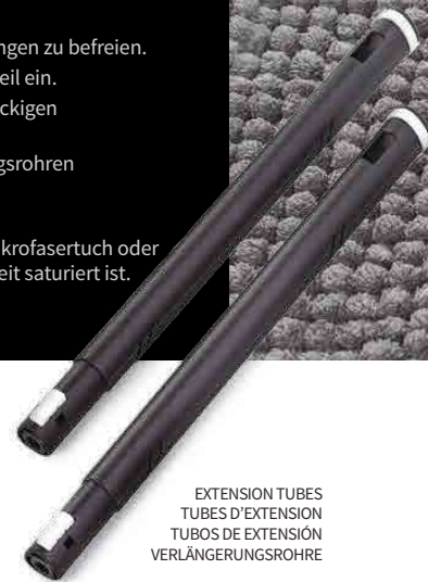
EXTENSION TUBES TUBES D'EXTENSION TUBOS DE EXTENSION VERLÄNGERUNGSROHRE