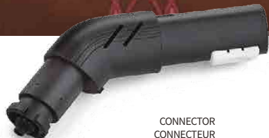
CONNECTOR CONNECTEUR CONECTOR VERBINDUNGSELEMENT