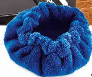
MICROFIBER BONNET BONNET DE MICROFIBRE CAPUCHA DE MICROFIBRA MIKROFASERHAUBE