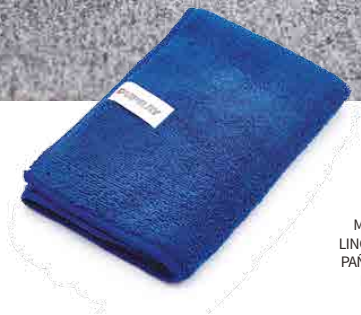
MICROFIBER CLOTH LINGE DE MICROFIBRE PAÑO DE MICROFIBRA MIKROFASERTUCH