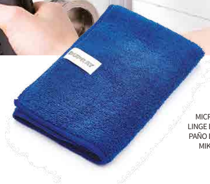
MICROFIBER CLOTH LINGE DE MICROFIBRE PAÑO DE MICROFIBRA MIKROFASERTUCH