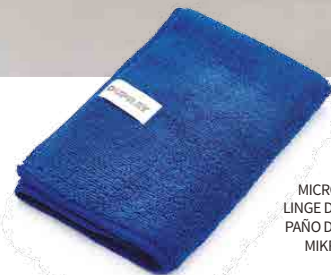
MICROFIBER CLOTH LINGE DE MICROFIBRE PAÑO DE MICROFIBRA MIKROFASERTUCH