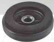
PLUNGER TOOL OUTIL DE PLOMBERIE HERRAMIENTA DE FONTANERIA SAUGGLOCKE