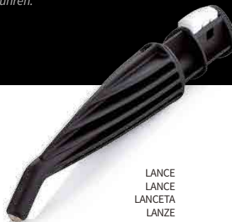
LANCE LANCE LANCETA LANZE

RECOMMENDED TOOLS OUTILS RECOMMANDÉS HERRAMIENTAS RECOMENDADAS EMPFOHLENES ZUBEHÖR