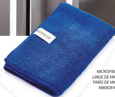
MICROFIBER CLOTH LINGE DE MICROFIBRE PAÑO DE MICROFIBRA MIKROFASERTUCH