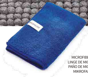
MICROFIBER CLOTH LINGE DE MICROFIBRE PAÑO DE MICROFIBRA MIKROFASERTUCH