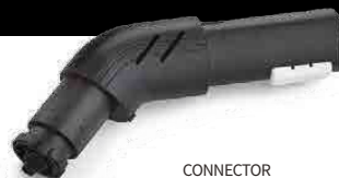
CONNECTOR CONNECTEUR CONECTOR VERBINDUNGSELEMENT

RECOMMENDED TOOLS OUTILS RECOMMANDÉS HERRAMIENTAS RECOMENDADAS EMPFOHLENES ZUBEHÖR