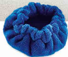
MICROFIBER BONNET BONNET DE MICROFIBRE CAPUCHA DE MICROFIBRA MIKROFASERHAUBE