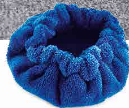
MICROFIBER BONNET BONNET DE MICROFIBRE CAPUCHA DE MICROFIBRA MIKROFASERHAUBE