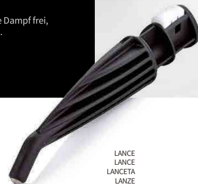
LANCE LANCE LANCETA LANZE

RECOMMENDED TOOLS OUTILS RECOMMANDÉS HERRAMIENTAS RECOMENDADAS EMPFOHLENES ZUBEHÖR