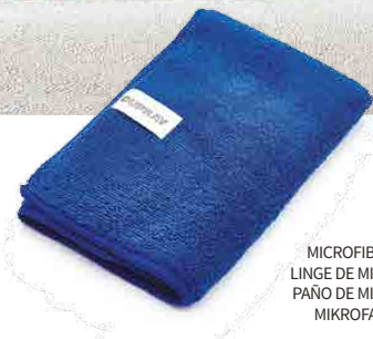
MICROFIBER CLOTH LINGE DE MICROFIBRE PAÑO DE MICROFIBRA MIKROFASERTUCH