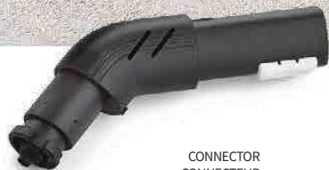
CONNECTOR CONNECTEUR CONECTOR VERBINDUNGSELEMENT