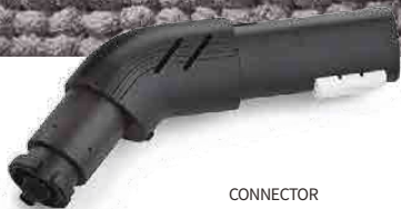
CONNECTOR CONNECTEUR CONECTOR VERBINDUNGSELEMENT