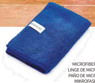
MICROFIBER CLOTH LINGE DE MICROFIBRE PAÑO DE MICROFIBRA MIKROFASERTUCH