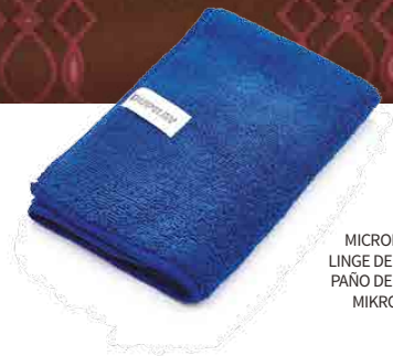
MICROFIBER CLOTH LINGE DE MICROFIBRE PAÑO DE MICROFIBRA MIKROFASERTUCH