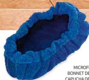
MICROFIBER BONNET BONNET DE MICROFIBRE CAPUCHA DE MICROFIBRA MIKROFASERHAUBE