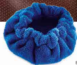
MICROFIBER BONNET BONNET DE MICROFIBRE CAPUCHA DE MICROFIBRA MIKROFASERHAUBE