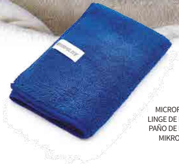
MICROFIBER CLOTH LINGE DE MICROFIBRE PAÑO DE MICROFIBRA MIKROFASERTUCH