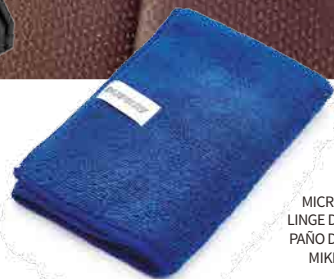
MICROFIBER CLOTH LINGE DE MICROFIBRE PAÑO DE MICROFIBRA MIKROFASERTUCH