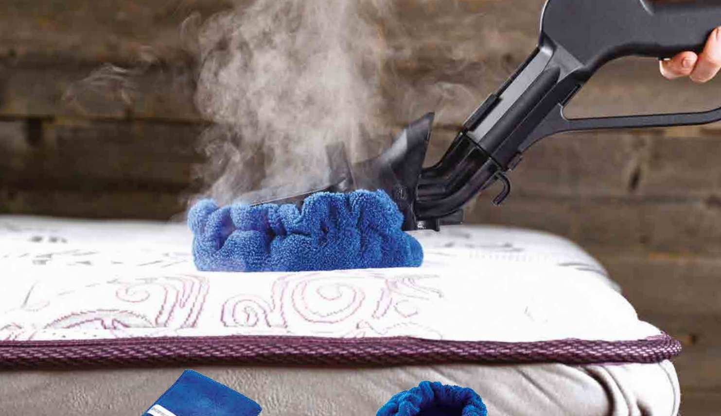
MICROFIBER CLOTH LINGE DE MICROFIBRE PAÑO DE MICROFIBRA MIKROFASERTUCH