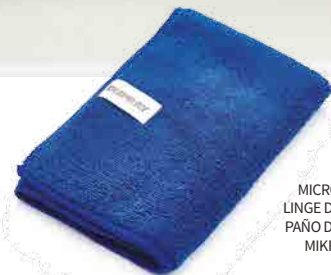
MICROFIBER CLOTH LINGE DE MICROFIBRE PAÑO DE MICROFIBRA MIKROFASERTUCH