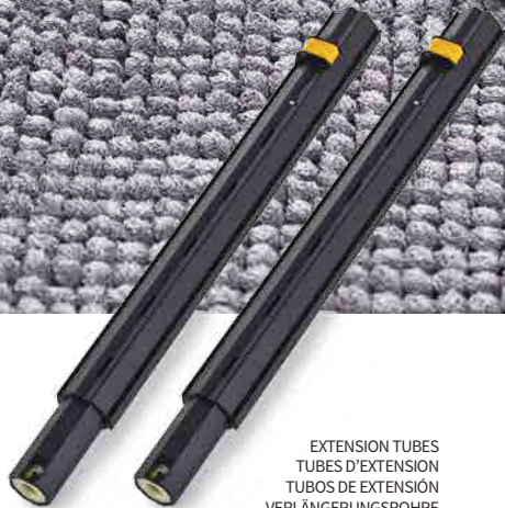
EXTENSION TUBES TUBES D'EXTENSION TUBOS DE EXTENSIÓN VERLÄNGERUNGSRÖHRE