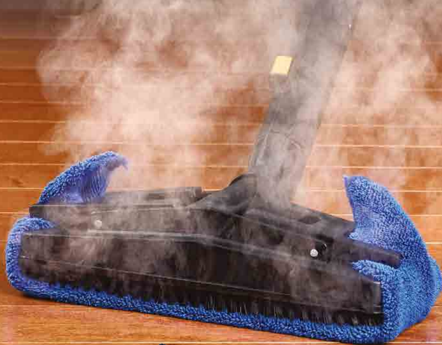
RECTANGULAR TOOL OUTIL RECTANGULAIRE HERRAMIENTA RECTANGULAR RECHTECKIGES ZUBEHÖRTEIL