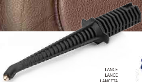
LANCE LANCE LANCETA LANZE