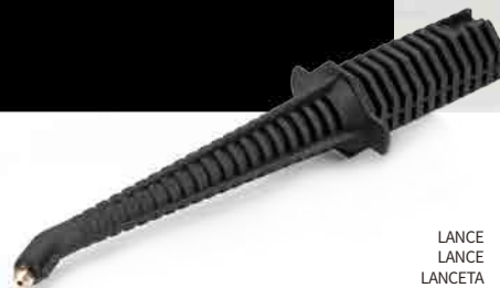
LANCE LANCE LANCETA LANZE

RECOMMENDED TOOLS OUTILS RECOMMANDÉS HERRAMIENTAS RECOMENDADAS EMPFOHLENES ZUBEHÖR