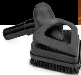
TRIANGULAR TOOL OUTIL TRIANGULAIRE HERRAMIENTA TRIANGULAR DREIECKIGES ZUBEHÖRTEIL

RECOMMENDED TOOLS OUTILS RECOMMANDÉS HERRAMIENTAS RECOMENDADAS EMPFOHLENES ZUBEHÖR