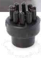
SMALL NYLON BRUSH PETITE BROSSE DE NYLON PEQUEÑO CEPILLO DE NYLON KLEINE NYLONBÜRSTE