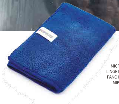
MICROFIBER CLOTH LINGE DE MICROFIBRE PAÑO DE MICROFIBRA MIKROFASERTUCH