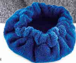
MICROFIBER BONNET BONNET DE MICROFIBRE CAPUCHA DE MICROFIBRA MIKROFASERHAUBE