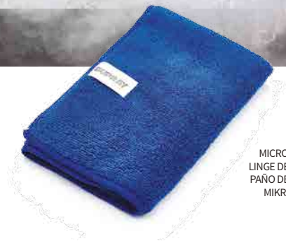
MICROFIBER CLOTH LINGE DE MICROFIBRE PAÑO DE MICROFIBRA MIKROFASERTUCH