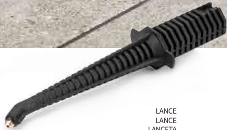
LANCE LANCE LANCETA LANZE