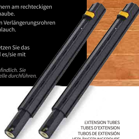
EXTENSION TUBES TUBES D'EXTENSION TUBOS DE EXTENSIÓN VERLÄNGERUNGSRÖHRE

RECOMMENDED TOOLS OUTILS RECOMMANDÉS HERRAMIENTAS RECOMENDADAS EMPFOHLENES ZUBEHÖR