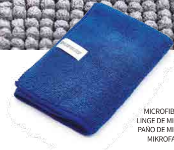
MICROFIBER CLOTH LINGE DE MICROFIBRE PAÑO DE MICROFIBRA MIKROFASERTUCH