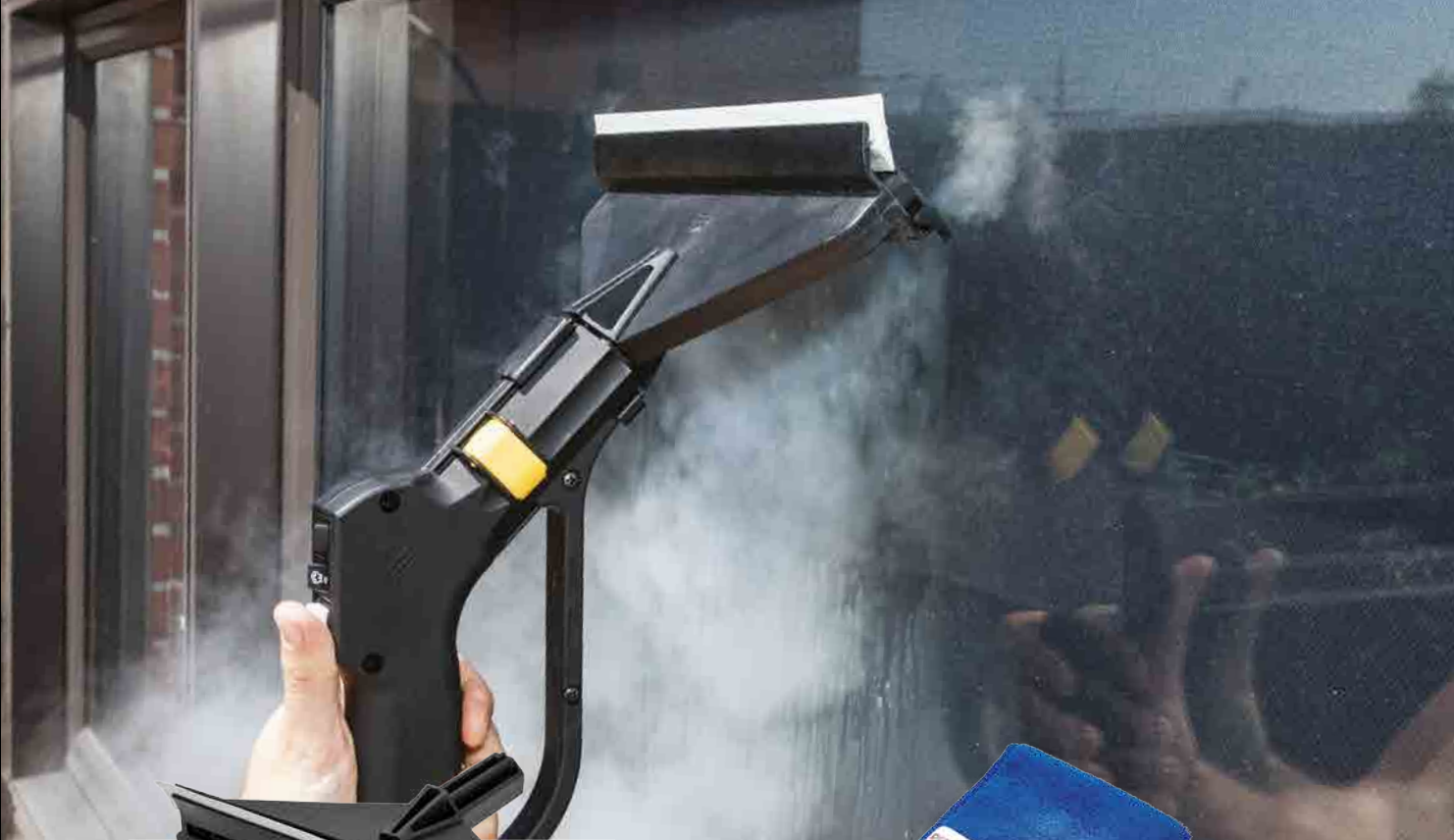
WINDOW TOOL OUTIL À FENÊTRES HERRAMIENTA DE VENTANA FENSTERZUBEHÖR