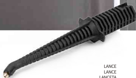
LANCE LANCEN LANCETA LANZE