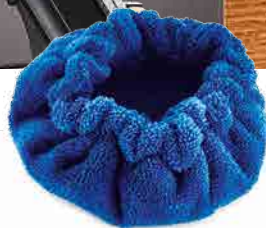
MICROFIBER BONNET BONNET DE MICROFIBRE CAPUCHA DE MICROFIBRA MIKROFASERHAUBE