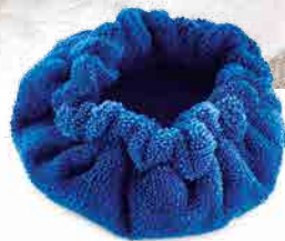
MICROFIBER BONNET BONNET DE MICROFIBRE CAPUCHA DE MICROFIBRA MIKROFASERHAUBE