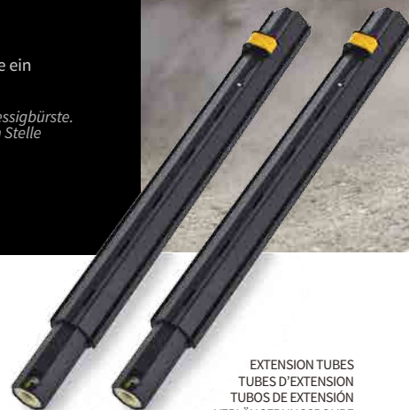
EXTENSION TUBES TUBES D'EXTENSION TUBOS DE EXTENSIÓN VERLÄNGERUNGSROHRE

RECOMMENDED TOOLS OUTILS RECOMMANDÉS HERRAMIENTAS RECOMENDADAS EMPFOHLENES ZUBEHÖR