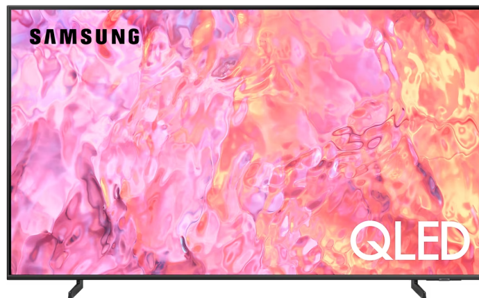
Télé QLED 4K

16810 70 PO 1013$ Rég. 1249$ Épargnez 236$