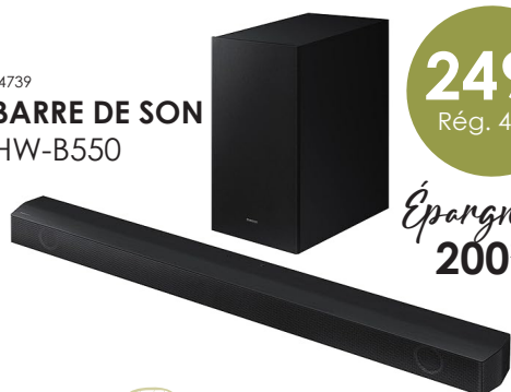
14739 BARRE DE SON HW-B550

15148 65 PO 1999$ Rég. 2799$ Épargnez 800$