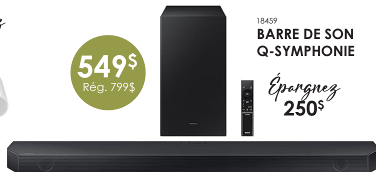
18459 BARRE DE SON Q-SYMPHONIE