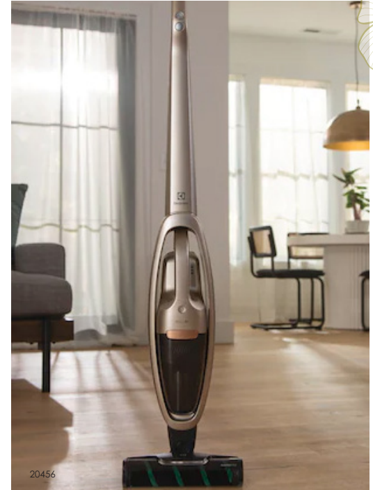
Aspirateur Ultimate800™ pour poils d'animaux 699$