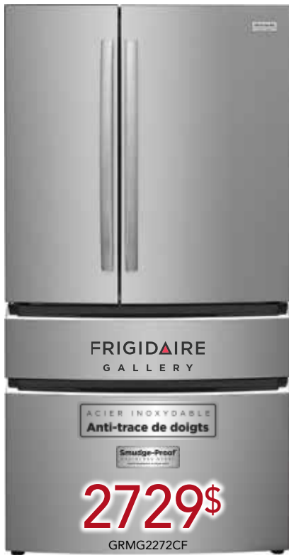
Réfrigérateur 4 portes 22,1 Pi³ à profondeur de comptoir 22.1 cu. ft. Counter-Depth 4-Door French Door Refrigerator