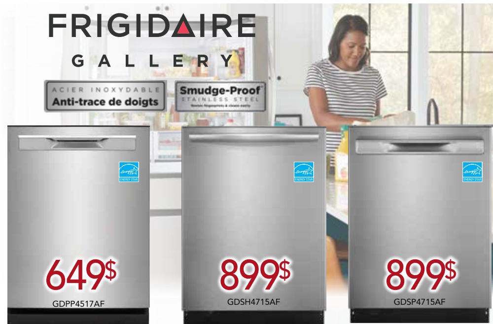
Lave-vaisselle encastré en acier inoxydable de 24 po. 24" Stainless Steel Tub Built-In Dishwasher

Des appareils de cuisine pour un quotidien en santé. A kitchen suite for happier and healthier living.