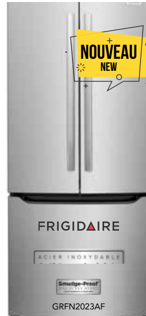
Réfrigérateur 20,0 Pi³ à profondeur standard avec porte Française. 20.0 Cu. Ft. Standard-Depth French Door Refrigerator