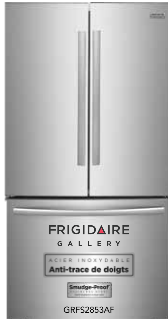
Réfrigérateur 27,8 Pi³ à porte Française 27.8 Cu. Ft. French Door Refrigerator