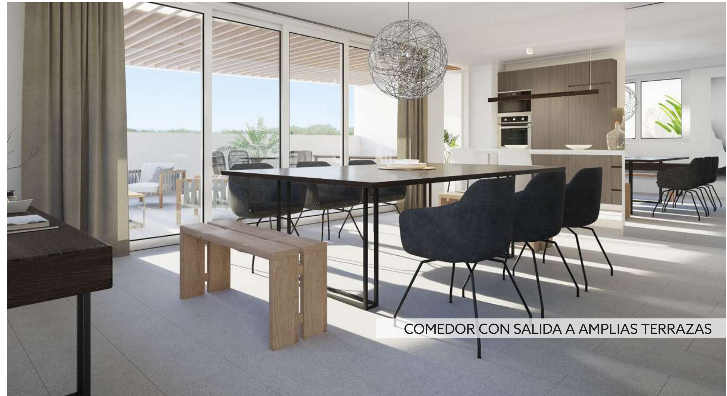
COMEDOR CON SALIDA A AMPLIAS TERRAZAS