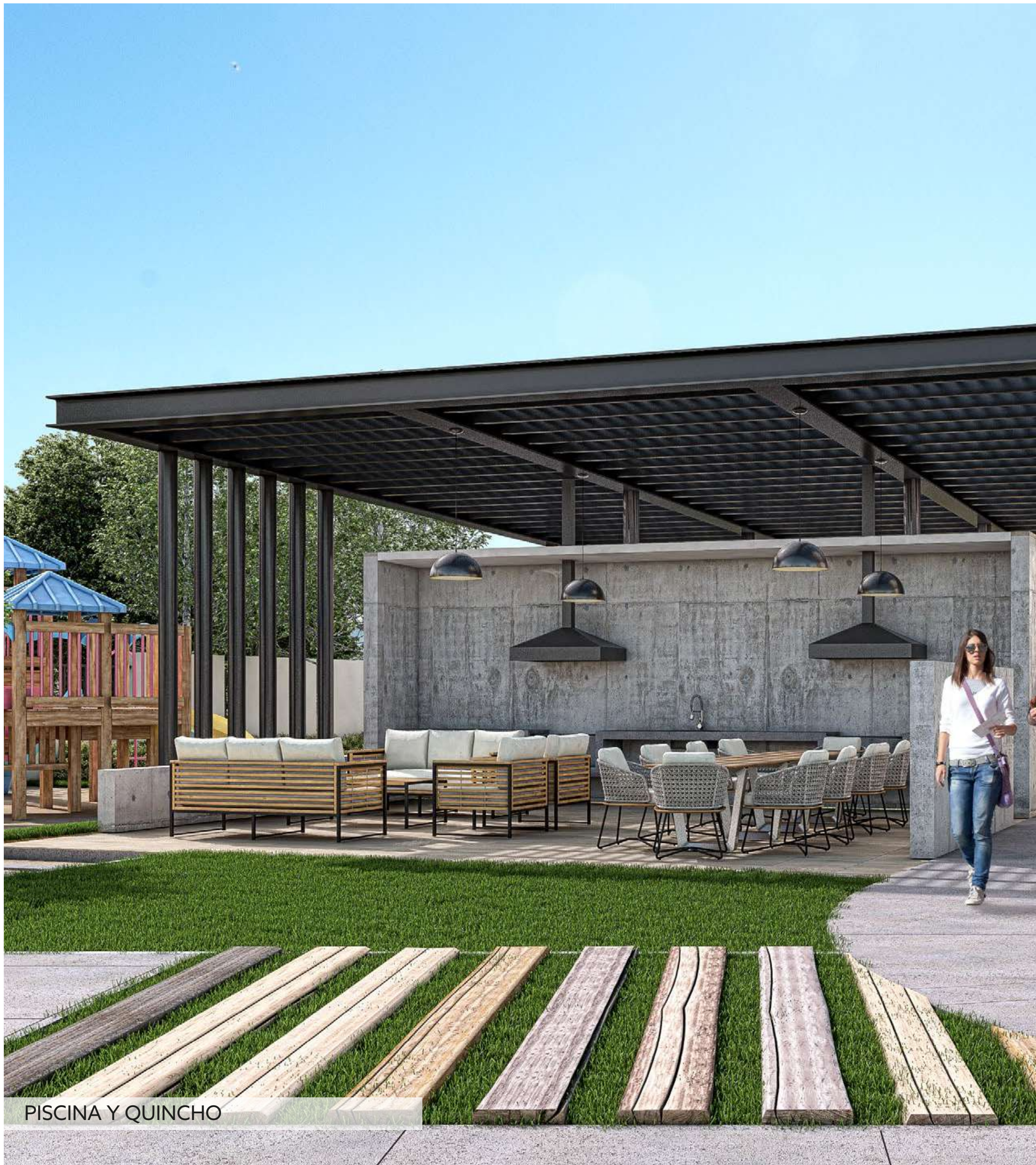
PISCINA Y QUINCHO