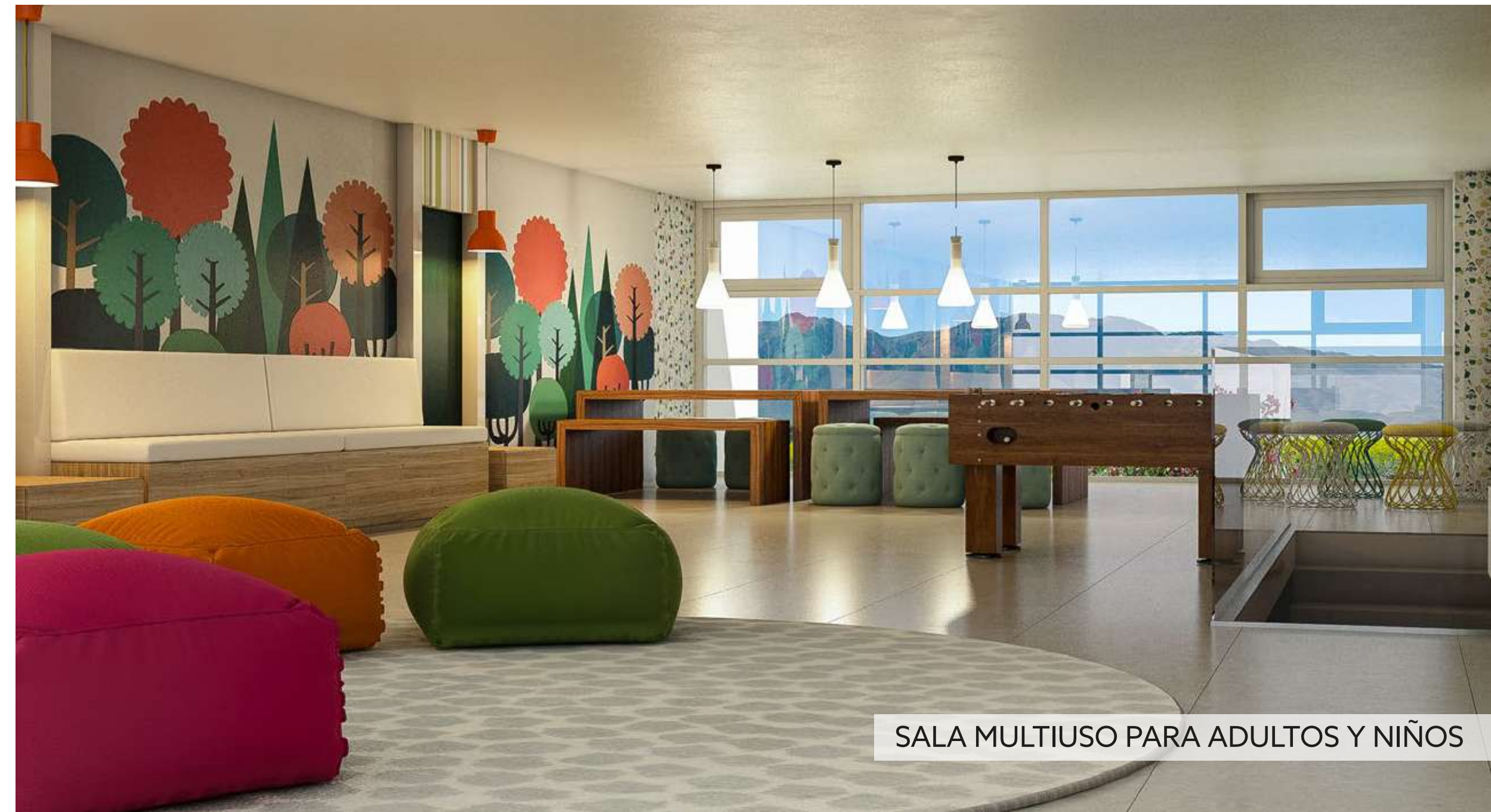
SALA MULTIUSO PARA ADULTOS Y NIÑOS