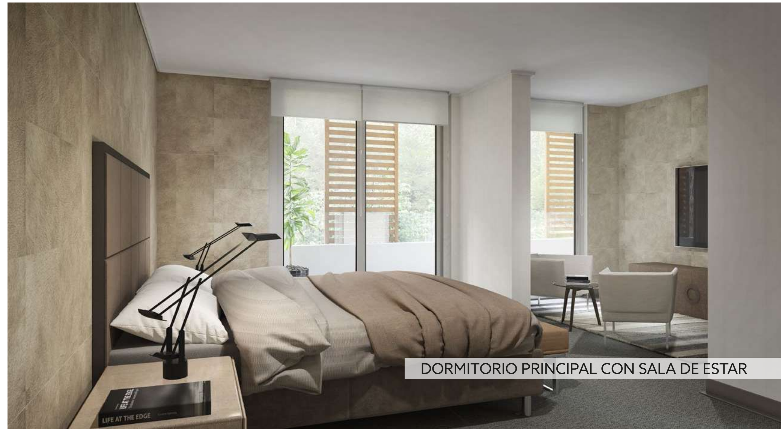
DORMITORIO PRINCIPAL CON SALA DE ESTAR