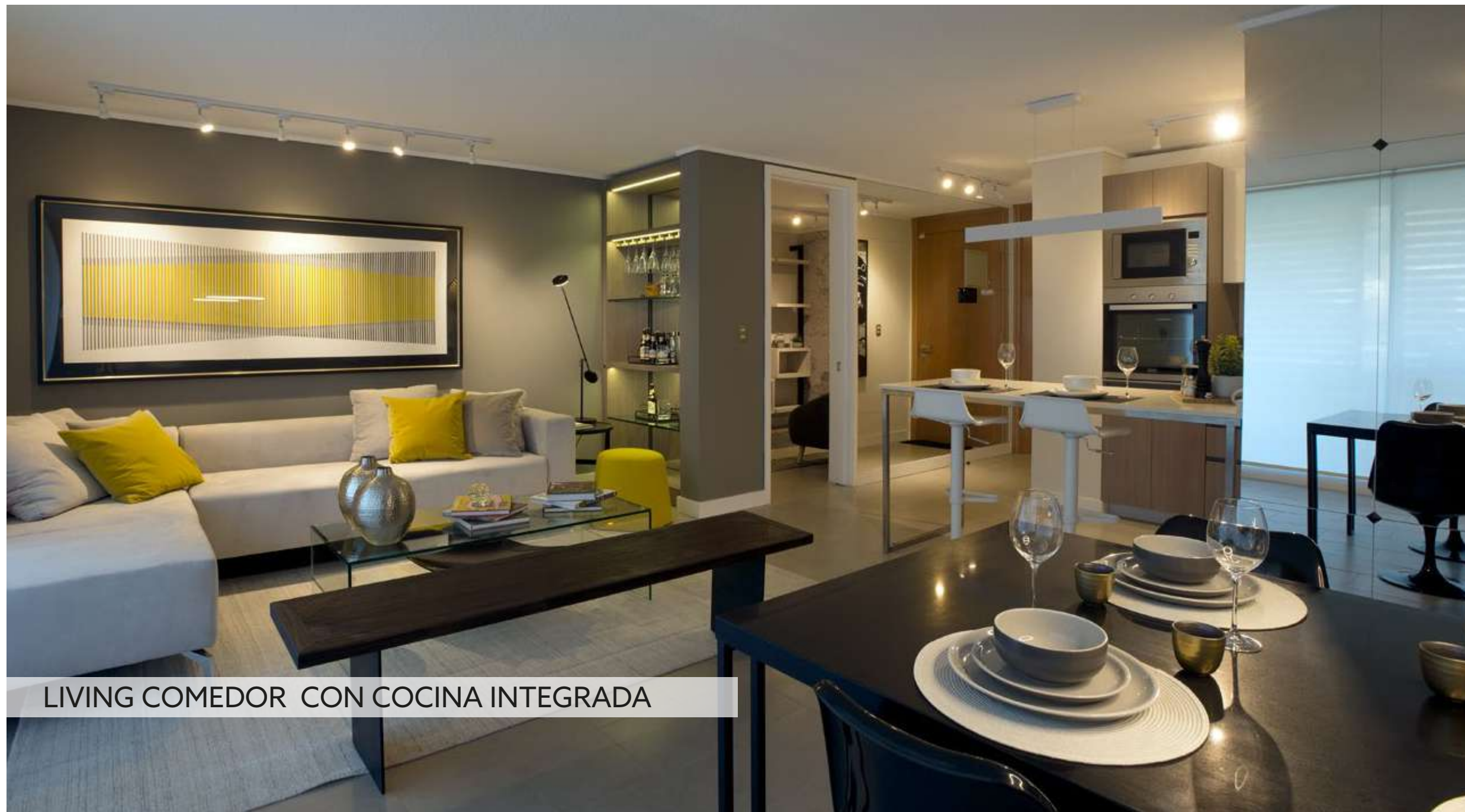
LIVING COMEDOR CON COCINA INTEGRADA