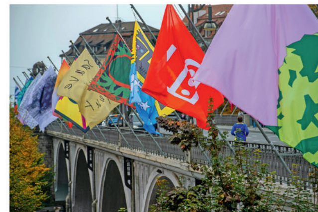
Sur les 207 drapaux en provenance de Suisse, le jury en a sélectionnés 36. Comme les 36 mâts du pont, utilisés le 1 er août en pour accompagner l'ouverture et l'événement hebdomadaire.