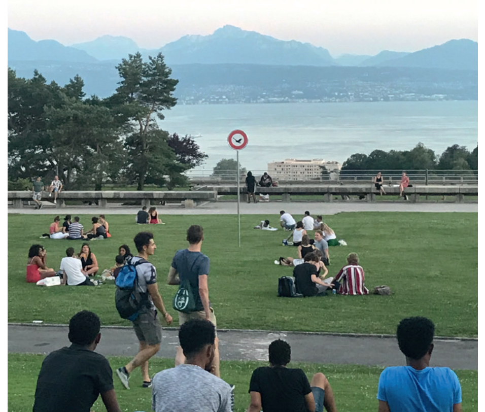
Espace d'une Sculpture, esplanade de Montbenon

Lukas Berchtold «Circulation interdite aux oiseaux».