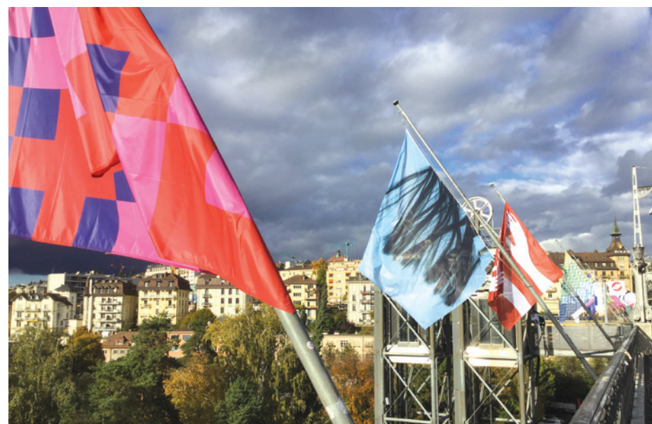
Exposition de drapeaux « Hissez haut » sur le pont Chauderon, du 28 octobre au 17 novembre