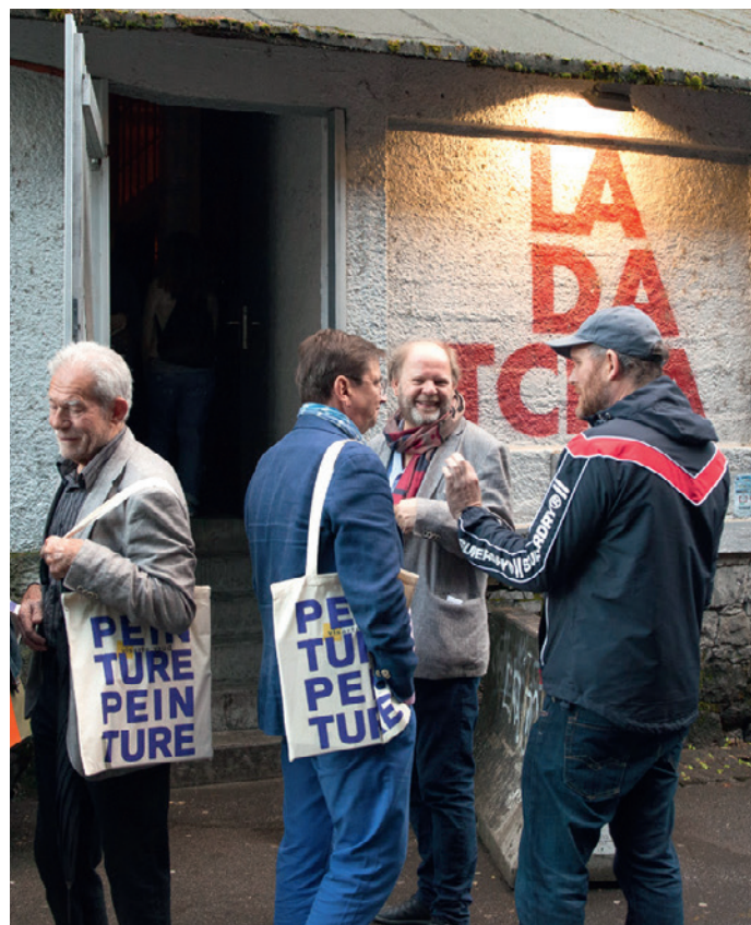
Peinture Peinture, vernissage du livre à la Datcha le 9 mai.