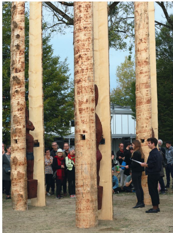
Installation « Château lapin » de Zaric à Vidy.

Vernissage avec lecture des Fables de Reichler.