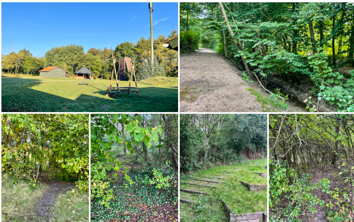
Billedkollage: Eksempler fra uderummene, hvor aktiviteterne fandt sted i Familieoplevelsesklubberne i Jylland og på Sjælland under observationerne.