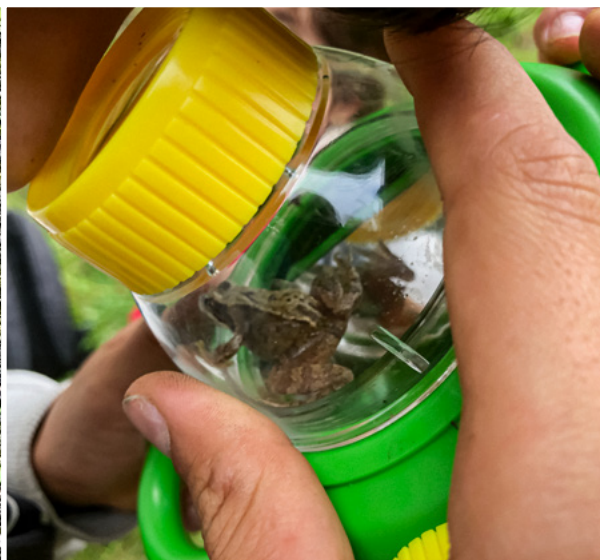
Billedkollage: Fra deltagerobservation i Familieoplevelsesklub på Sjælland, hvor de fandt en frø.