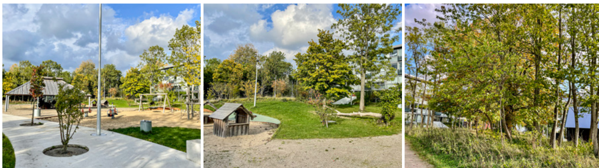
Billedkollage: Eksempler fra uderummet, hvor aktiviteterne fandt sted i Naturklub i Jylland under observationerne.