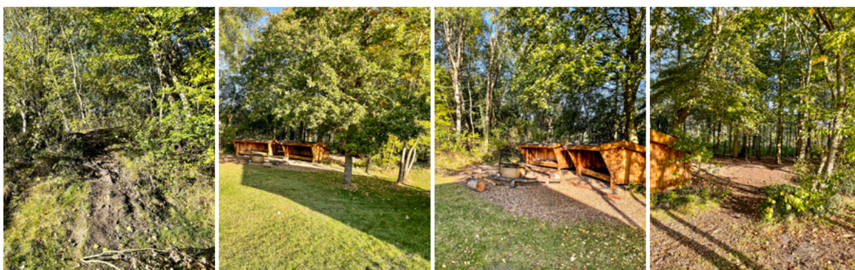
Billedkollage: Shelterplads der skaber et "rum i rummet" jf. deltagerobservation i Familieoplevelsesklub i Jylland.

(Deltagerobservation, Familieoplevelsesklub klub i Jylland)