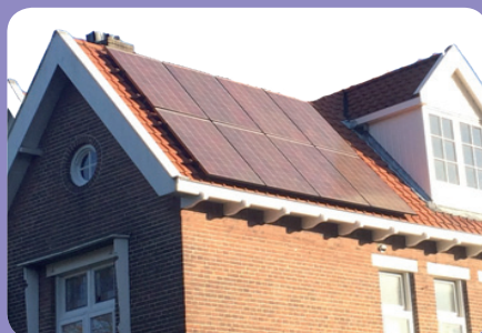
Type B Visueel geïntegreerde oplossingen

Dit zijn zonnepanelen die als losse elementen in of op het dak zijn aangebracht zonder nadere kwaliteitscriteria m.b.t. de uitvoering.