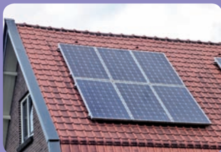
Type A Niet-geïntegreerde zonnepanelen

Er bestaan verschillende typen zonnepanelen. Wanneer voor het plaatsen van zonnepanelen een vergunning nodig is (en kan worden verleend: zie het bovenstaande overzicht), kunnen er eisen worden gesteld aan bijvoorbeeld de vorm, kleur of uitvoering van de zonnepanelen. Op daken waar vergunningvrij zonnepanelen mogen worden toegepast zijn alle typen toegestaan. In het belang van de kwaliteit van de waardevolle stadsgezichten, is ook hier het advies om de vorm, kleur en positie van de panelen zo goed mogelijk te laten aansluiten bij het dak en de omgeving.