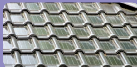
Type C In de architectuur geïntegreerde oplossingen

Dit zijn zonnepanelen die zijn opgenomen in de dakbedekking en niet als losse elementen op of in het dak zijn aangebracht.