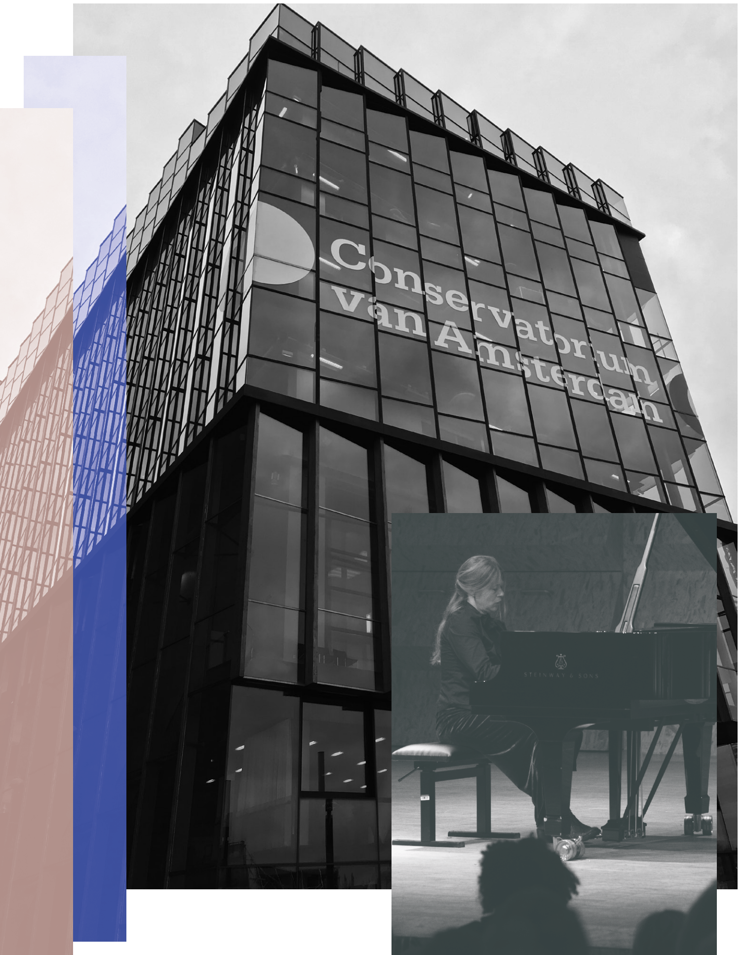
Winnares PianoFest 2018 Hermingard Vogelsang