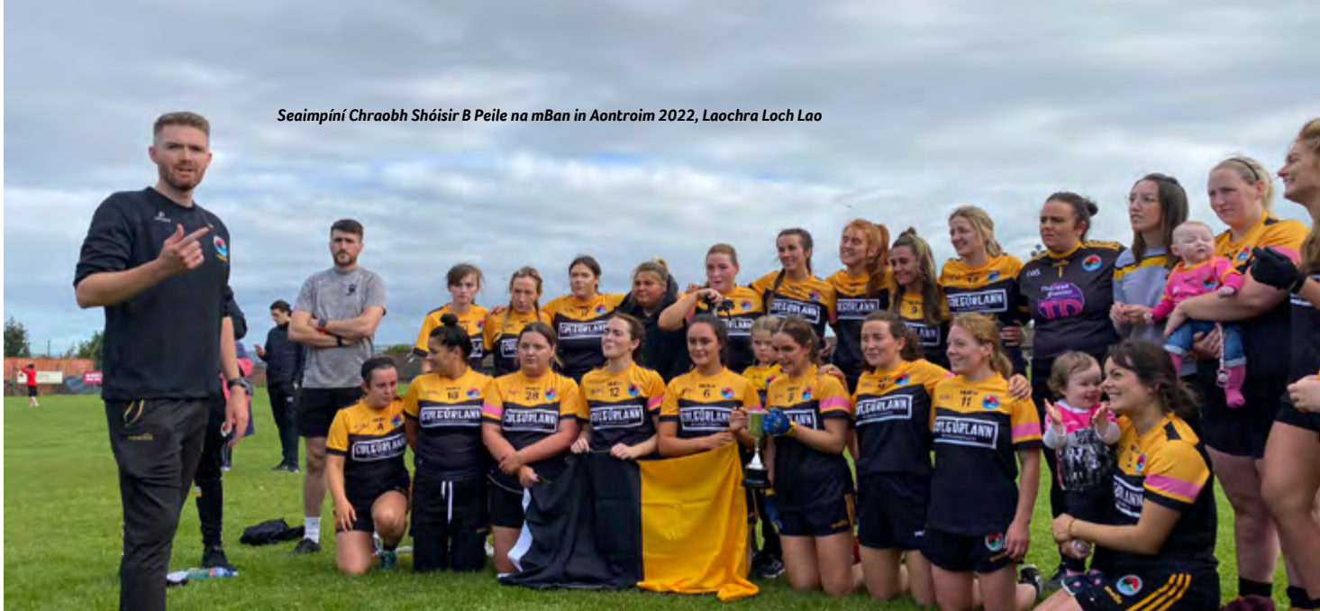
Seaimpiní Chraobh Shóisir B Peile na mBan in Aontroim 2022, Laochra Loch Lao

“Tá Coláiste Feirste ar an Ghaelcholáiste is mó sa tír agus tá sé mar chineál lárionaid againn anseo. Bhí cuid mhór dár mbaill ar scoil ann. Ní thiocfadh leat áit ní ba fhóirsteanaí a fháil dúinn i mBéal Feirste ná an áit ina bhfuil muid.”