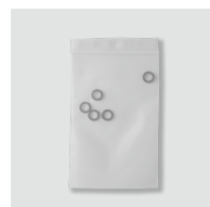
Kit joints SP34 / 8650.34 Pour l'entretien des joints de l'appareil (à effectuer une fois par an).