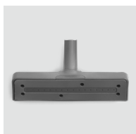
Support microfibre SP240 / 8620.240 Pour les petites surfaces hautes et planes.