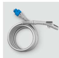
Gaine vapeur SP45 / 8630.45 Avec poignée ergonomique à commandes tactiles.