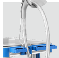
Guide gaine SP151 / 8620.151 Pour une meilleure ergonomie lors de l'utilisation.