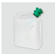
Bidon de remplissage SN1319 Bidon vide de 5L pour faciliter le remplissage du générateur.