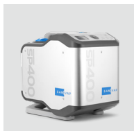
Générateur vapeur SP400 / 8600.400 Notre générateur vapeur 2850w.