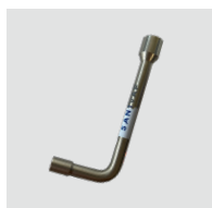
Clé de vidange SN1320 Facilite la vidange de l'appareil (à effectuer toutes les 20 heures de chauffe).