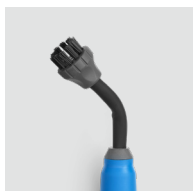
Buse coudée SP200 / 8620.200 Pour les zones étroites et difficiles d'accès.