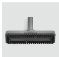
Brosse 20 cm SP220 / 8620.220 Pour les petites surfaces hautes.