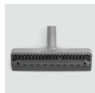
Brosse raclette SP230 / 8620.230 Pour les petites surfaces hautes ou verticales.