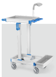
Chariot SP150 / 8620.150 Permet une plus grande mobilité.