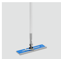
Balai MOP vapeur SP250 / 8620.250 Pour les sols, murs et plafonds.