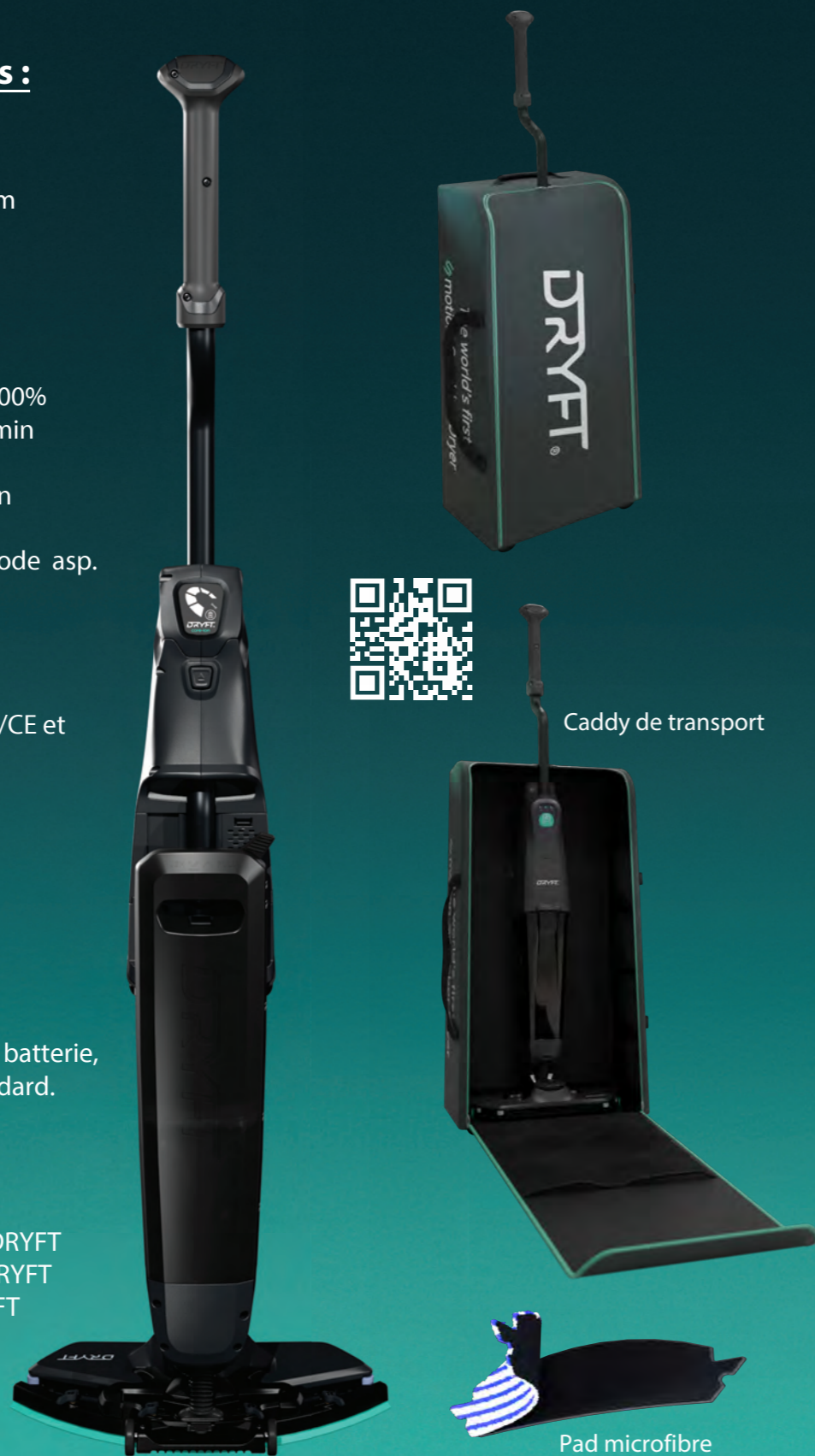
Caddy de transport

040-0004 Pad de nettoyage standard DRYFT 040-0035-5 Lot de 5 pads microfibre DRYFT 200-S26 Jeux de raclette LINATEX DRYFT 060-0001 Caddy de transport DRYFT 005-0011 Batterie core-ion DRYFT