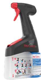
Compatible avec le pulvérisateur TruShot 2.0®