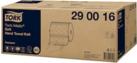
EM Tork Matic Premium 2p rl 100m H1 290016