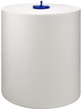
Tork Universal EM rouleau 290059