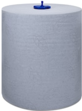
Tork Matic Ess-mains roul. bleu 290068