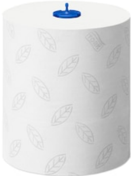
Tork Matic Ess-mains roul. doux 290067