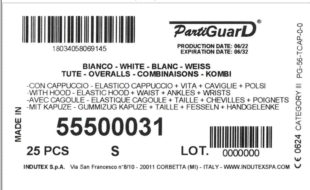
Etiquette pour carton