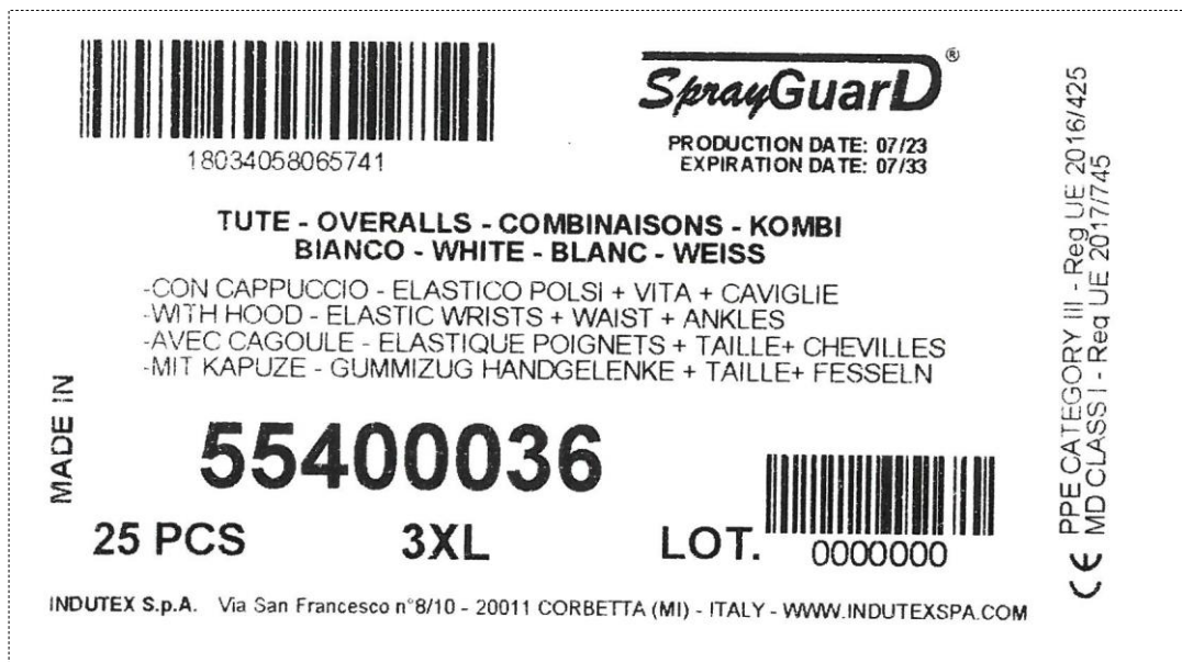
Etiquette pour carton