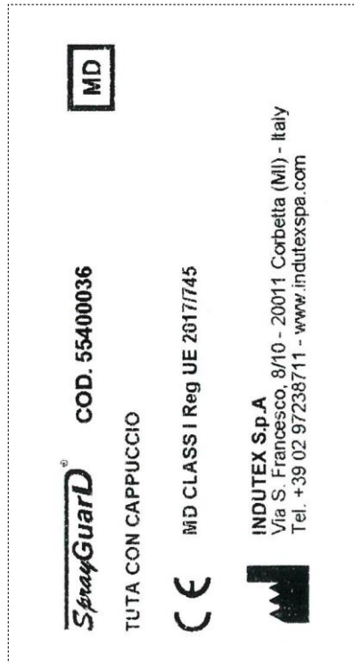
Etiquette taille pour vêtement MD