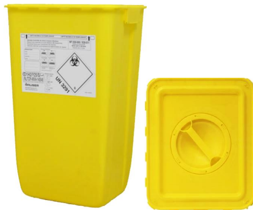
● Réf. 676565 – Jaune – fût + couvercle

La gamme DASRI est destinée à la collecte des déchets à risques infectieux liés à l'administration des soins. Utilisable pour tout types de déchets piquants, coupants, tranchants.