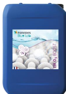
LIX O3 BOOST