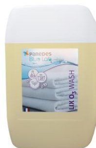
LIX O3 WASH